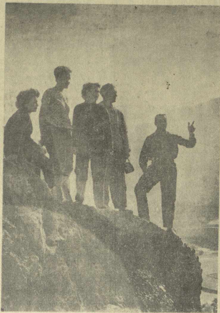
ТУРИСТЫ В СВАНЕТИИ.