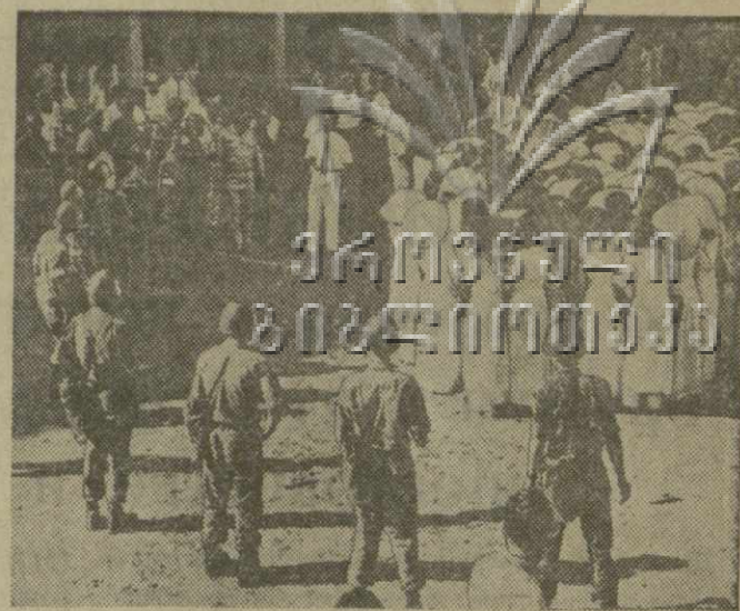
Аресты школьников и студентов, преследования буддистов, кровавый террор над населением городов и деревень Южного Вьетнама — так правит гноимьяемская клика, поддерживаемая Соединенными Штатами Америки. Недавно в Сайгоне вооруженные солдаты арестовали несколько сот учащихся средних школ в возрасте от 13 до 18 лет — участников антиправительственной демонстрации. На снимке: солдаты окружили арестованных школьников.

Совет министров установил следующие воинские звания: главный майор, армейский майор, корпусной майор, дивизионный майор, майор, первый капитан, капитан, старший лейтенант, лейтенант, младший лейтенант, старший сержант, сержант, младший сержант, капрал, солдат.