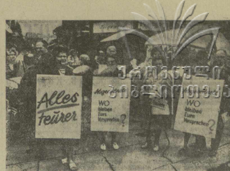
Австрия. На венском рынке состоялась демонстрация, вызванная продолжающимся в стране ростом цен на продукты питания. Демонстранты потребовали от правительства принятия решительных мер для прекращения роста дороговизны.

Затем на утреннем пленарном заседании выступил министр иностранных дел Румынии Корнелиу Манеску и делегат Камбоджи. Корнелиу Манеску поддержал новые предложения о разоружении, внесенные на сессии министром иностранных дел СССР А. А. Громыко. «Румынская делегация считает, что предложение Советского Союза созвать на высшем уровне совещание государств, входящих в Комитет 18-ти по разоружению, в начале