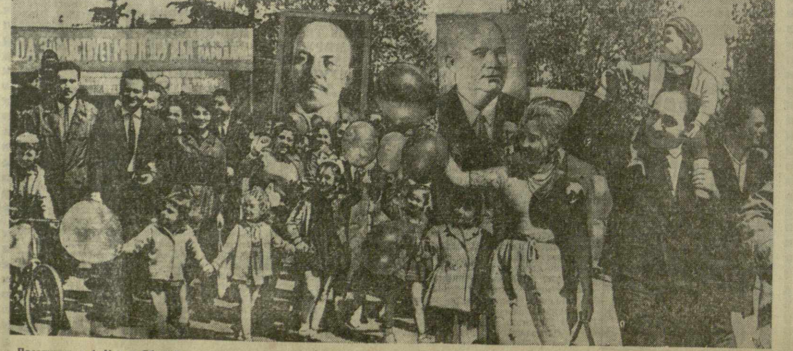
Празднование 1 Мая в Тбилиси. На снимке: колонны демонстрантов на проспекте Руставели.

Центральный Комитет КП Грузии, Совет Министров Грузинской ССР и Совпроф Грузии отметили хорошую работу Махарадзевского, Дуакинского, Ланчхутского, Цхакаевского, Сигнахского, Гегечкорского, Амброладурского, Цхалтубского, Зестафонского и Мажковского производственных управлений по заготовке животноводческих продуктов. (ГрузТАГ).