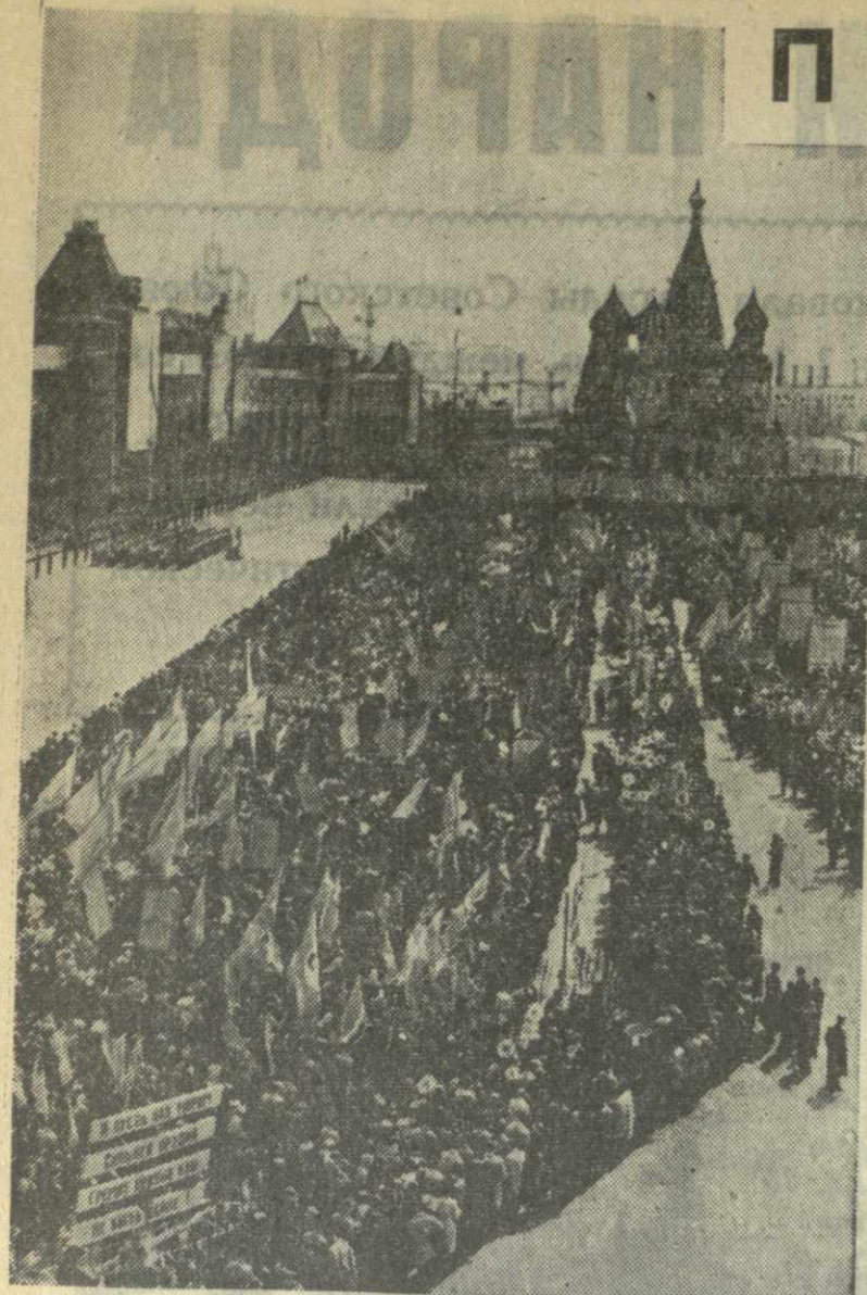
Празднование 1 Мая 1964 года в Москве. Демонстрация представителей трудящихся. На снимке: на Красной площади.

Г. ДАВЫДОВ, А. ЛИСИН, Г. МАКАРОВ, А. СУРИН. (Спец. корр. ТАСС). Москва, Красная площадь, 1 мая.