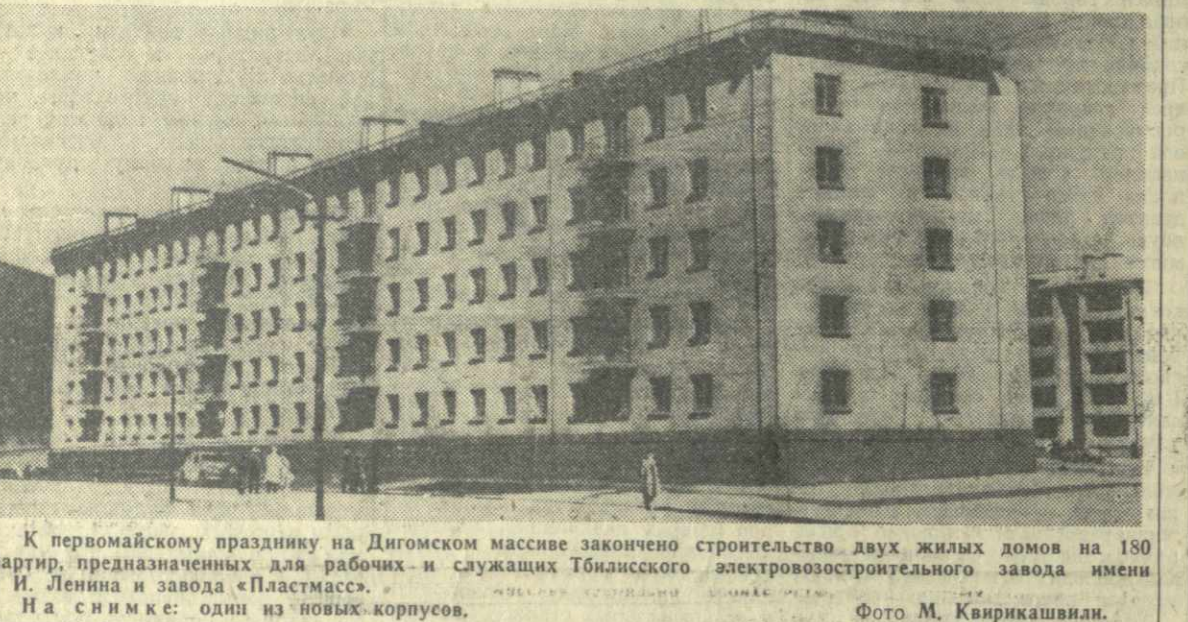
К Первомайскому празднику на Дигомском массиве закончено строительство двух жилых домов на 180 квартир...