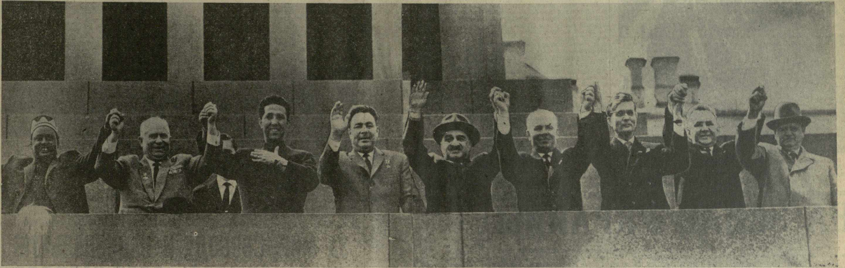
МОСКВА. На трибуне Мавзолея 1 Мая 1964 года. Слева направо — Ажума Огинга Одингга, Н. С. Хрущев, Ахмед Бен Белла, Л. И. Брежнев, А. И. Микоян, Н. В. Подгорный, М. А. Суслов, А. Н. Косыгин, Н. М. Шверник.

Торжественно и радостно отпраздновали народы Советского Союза вместе со всем трудовым человечеством 1 Мая — день международной солидарности трудящихся, день единства и братства рабочих всех стран. Первомайские торжества с новой силой продемонстрировали нерушимую сплоченность трудящихся нашей страны вокруг Коммунистической партии и ее ленинского Центрального Комитета.