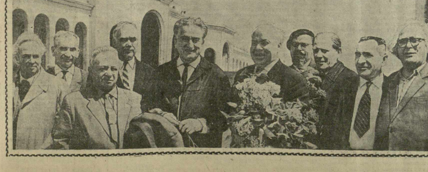
Торжественные заседания, посвященные Дню печати

Вместе с алжирскими друзьями в Ленинград прибыли секретарь ЦК КПСС В. Н. Пономарев, заместитель министра иностранных дел СССР Я. А. Малин и другие официальные лица.