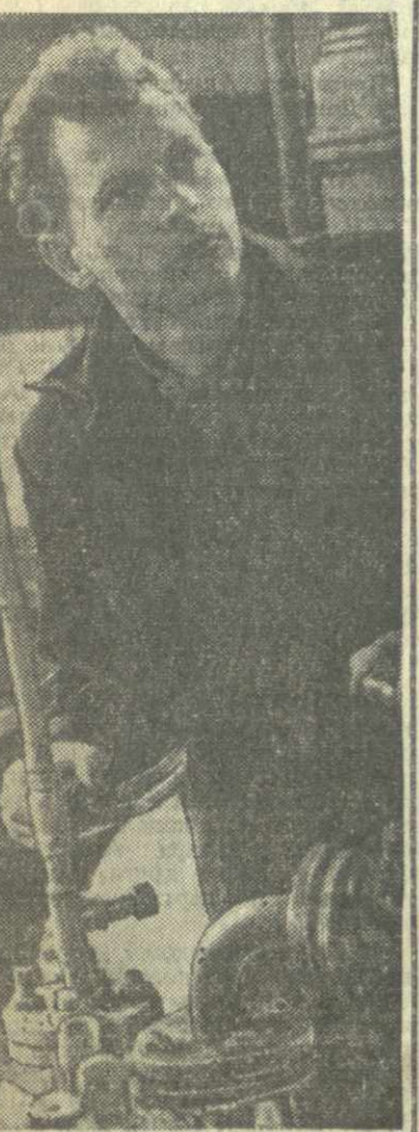
Батумский кофенный завод — одно из крупнейших химических предприятий республики. Он выпускает медицинские препараты, которые экспортируются в 23 страны мира.

Постановлением комиссии материалы проверки направлены для соответствующего реагирования Министерству строительства Грузинской ССР, исполнителю комитета городских и районных Советов депутатов трудящихся. (ГрузТАГ).