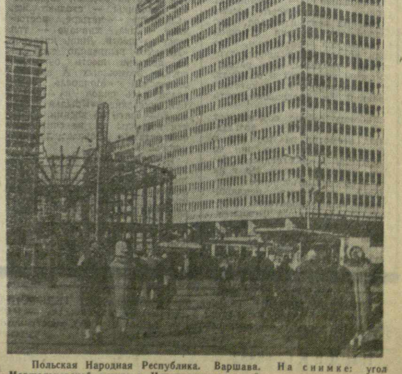
Польская Народная Республика. Варшава. На снимке: угол Маршаловской улицы и Иерусалимских аллей.

«С предельной ясностью», — отмечает газета «Земледельское знамя», — руководителем Советского правительства Н. С. Хрущев в ответе корреспонденту газеты «Известия» раскрыл нечестные побуждения и планы империалистических сил, стремящихся путем братоубийственной войны превратить Кипр в «лепотоулемый аванпост» НАТО в восточной части Средиземноморья.