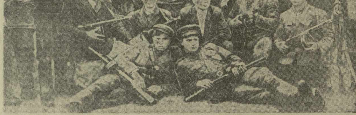
Перед вами, читатель, два снимка, сделанных в разное время: один — в годы Великой Отечественной войны, в глубоком вражеском тылу, а второй — почти 20 лет спустя...