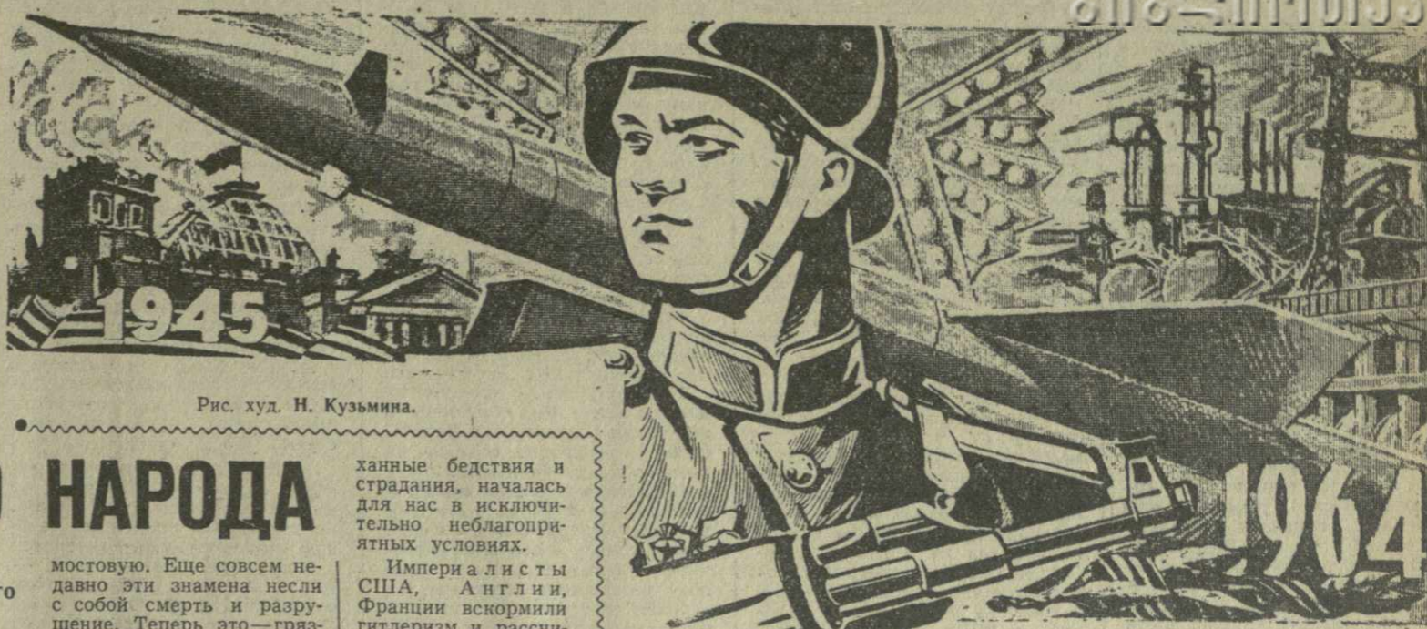
Рис. худ. Н. Кузьмина.

№ 108 (12038) Суббота, 9 мая 1964 года Цена 2 коп.