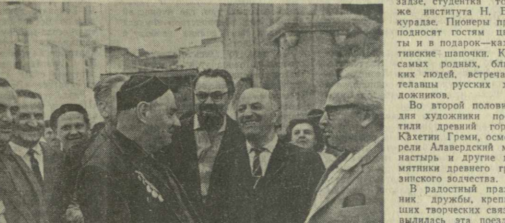
Сердечно встречали колхозники, представители сельской интеллигенции, молодежь, пионеры выдающихся советских художников в Кахети.