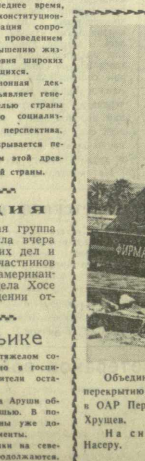
Объединенная Арабская Республика готовится к знаменательному событию — перекрытию Нила. В торжествах по этому случаю примет участие прибывший вчера в ОАР Первый секретарь ЦК КПСС, Председатель Совета Министров СССР Н. С. Хрущев. На снимке: пирамида с приветствиями Н. С. Хрущеву и Гамаль Абдель Насеру.

Народ и правительство ОАР встречают руководителя Советского правительства как своего самого лучшего и надежного друга, подчеркивает газета.