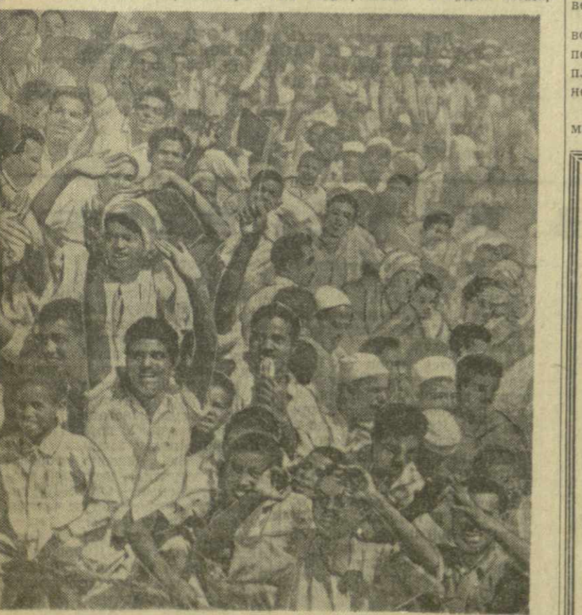
АСУАН. Ликуют египетские феллахи и строители плотины. Сблесая вековая мечта о покорении Нила. Великая победа над природой, одержанная с помощью советских людей, позволит оросить поля щедрым потоком живительной влаги.

Коммюнике подписали по поручению своих правительств первый заместитель Председателя Совета Министров СССР А. Н. Косыгин и министр внутренних дел Кении Огинга Одингги. (ТАСС).