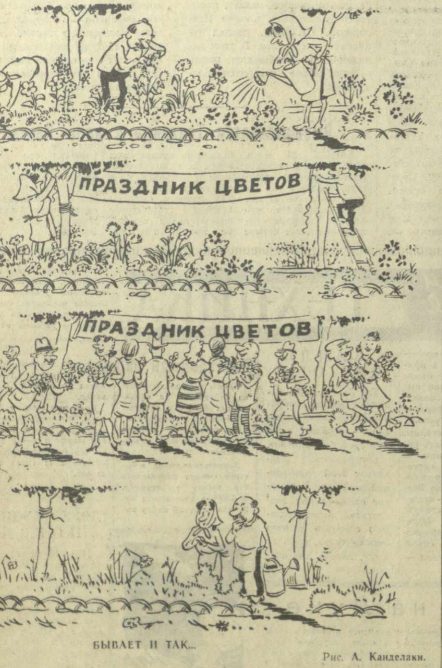
Бывает и так... Рис. А. Канделаки.

СУХУМИ. (Корр. «Зари Востока».) Сезон высокогорного туризма только начинается, но на сухум- ском турбазе «Синоп» уже много- людно. Здесь в комфортабельных, уютных комнатах отдыхает более 300 человек, любителей путеше- ствий по родному краю. Вместо па- латок на территории базы вырос- ли красивые многоэтажные соору- жения. В первом спальном корпу- се гостиничного типа 78 комнат. В каждой из них размещено по два-три человека. Среди сосново- роши и кипарисовых аллей вырос- ли десятки двухэтажных ориги- нальных коттеджей. К услугам туристов — двухэтажный корпус, в котором размещены кинотеатр, туристский кабинет, комната отды- ха, бильярдная, библиотека-чи- тальня, медицинский кабинет. В эти дни туристы совершают интересные экскурсии по достопримечательным местам города и его окрестностей, на высокогорное озе- ро Рица. — В нынешнем сезоне, — гово- рит директор базы Г. Мишеляни, — мы обслужим до 90 тысяч советских и иностранных туристов. В летние дни база ежедневно бу- дет принимать и отправлять до 700 человек.