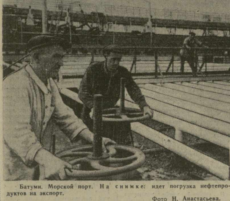
Батуми. Морской порт. На снимке: идет погрузка нефтепродуктов на экспорт.

Наш катер разворачивается. Подходим к нефтеналивному причалу. Батареи труб готовятся: скоро подойдет очередная партия нефти.