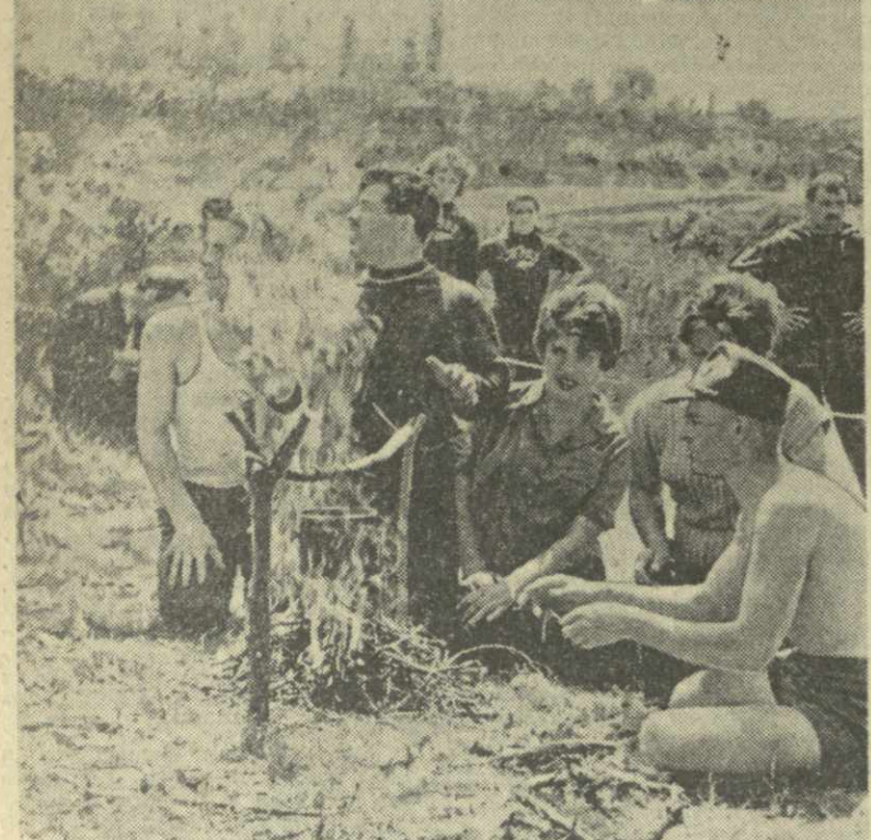
Рабочие Тбилисского станкостроительного завода имени С. М. Кирова на отдыхе в Цидамури.

Наступает лето — пора увлекательных походов и путешествий, загородных прогулок и экскурсий. Трудно усидеть дома в воскресный день: хочется на воздух — в горы, к берегам рек и озер.