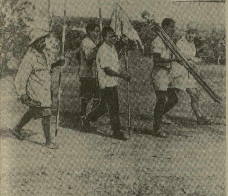
По приглашению правительства Гамы большая группа советских специалистов из природных богатств страны. Советские геологи в сотрудничестве с молодыми гамскими работниками уже разведали запасы свинца, золота, бокситов... Проводятся предварительные изыскания для строительства электростанции в Буи свинцового завода в Такаради. На с. н. м. к. советский специалист с гамскими помощниками отправляется на работу в местность.