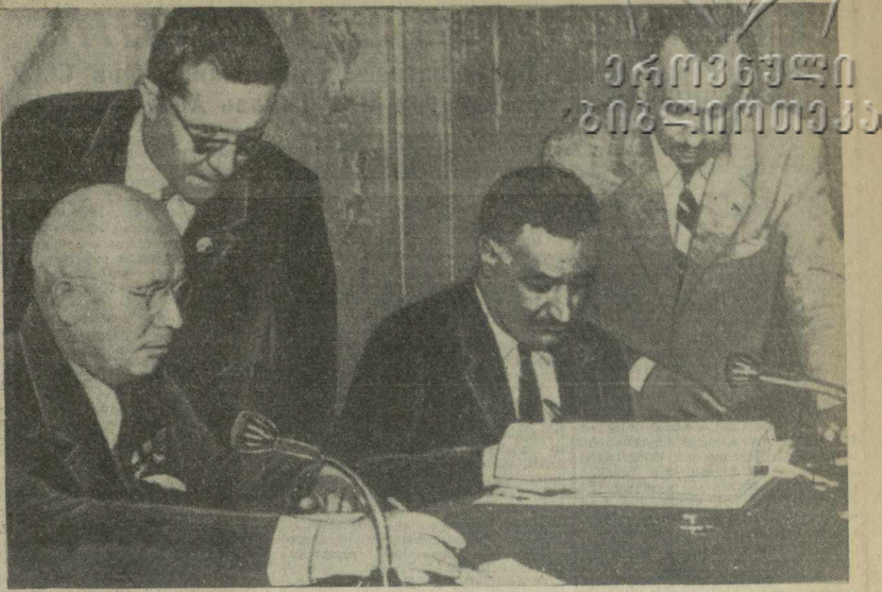
Каир, 24 мая. Подписание совместного заявления о переговорах между Председателем Совета Министров СССР Н. С. Хрущевым и Президентом Объединенной Арабской Республики Гамаль Абдель Насером.

Присутствующие горячо поздравляли Президента Гамаль Абдель Насера и маршала Абдель Хакима Амера с высокой наградой.