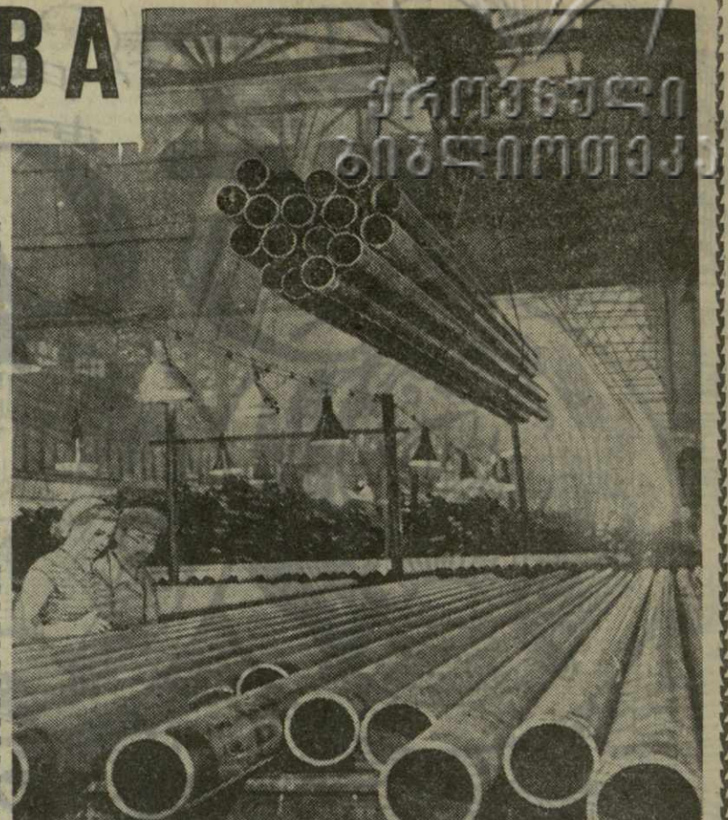
В цехе готовой продукции Сумгаитского трубопрокатного завода.

Живет и будет жить в веках ленинская дружба народов — основа мощи Советского многонационального государства, неиссякаемый источник всех наших побед в коммунистическом строительстве.