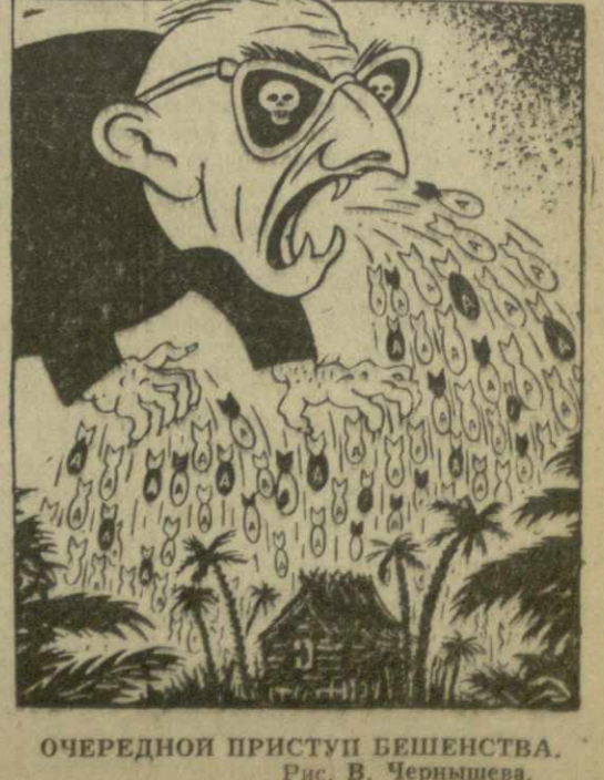
Очередной приступ бешенства. Рис. В. Чернышева.

Одни из лидеров американских «бенешев» сенатор Голдуотер призвал использовать в Юго-Восточной Азии атомное оружие. (Из газет).