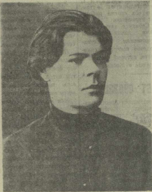
А. М. Горький. 1891 год.