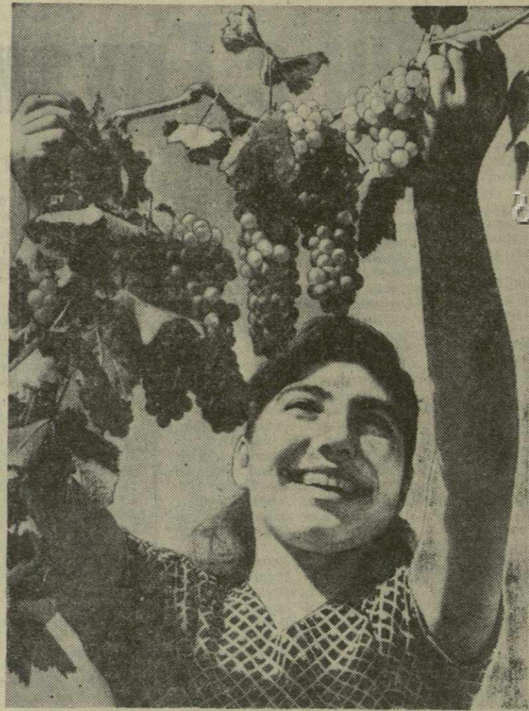
ИДЕТ РТВЕЛИ

Марка нашего предприятия, известная на Дальнем Востоке, Урале, в Целинном крае и северных областях страны, обязывает нас выпускать только высококачественную продукцию. Отзывы заказчиков говорят, что они довольны нашей продукцией.