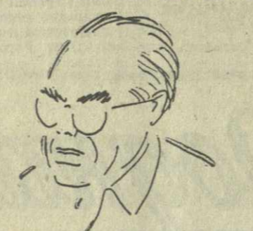
Тит «Заря Востока»... впечатлений будет очень много. А пока художник переводит стрелки часов на час вперед. Херлуф Бидstrup начинает жить по тбилисскому времени.