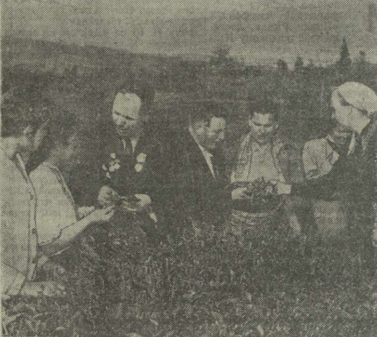
Крепкая дружба связывает махарадзевских и генеральных колхозников. На снимке: делегация сельских труженников Генчического района на чайных плантациях Махарадзевского района.