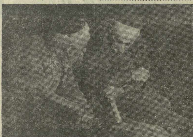
На снимке: кадр из фильма «Строители дороги».