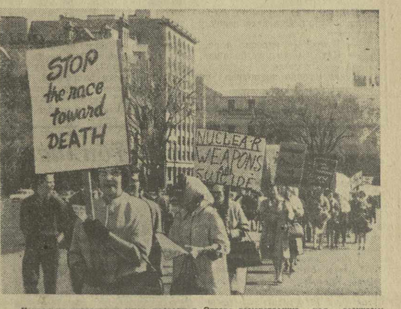
Канадские сторонники мира провели в Оттаве демонстрацию под лозунгом: «Вперед к Договору о запрещении ядерных испытаний, а не назад к канадо-американскому ядерному соглашению». На снимке: участники демонстрации с плакатами.

тисля во второразрядную, если не третьеразрядную страну. Наука в ФРГ переживает тяжелый период. Истинная причина прозябания науки заключается в чудовищно огромных военных расходах Бонна, пожирающих треть бюджета. А на развитие науки средств не хватает. Л. БУРНАШЕВ. (АПН.)