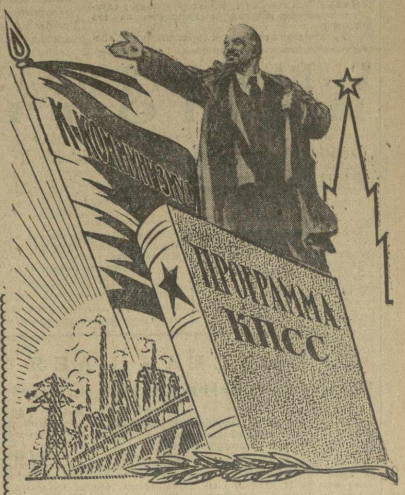
Плакат худ. В. Чернышева.

Партия призывает: — Трудящиеся Советского Союза! Все силы на выполнение Программы КПСС, решений XXII съезда партии! Вперед, к победе коммунизма! И советский народ единодушно отвечает на призыв своей родной Коммунистической партии самоотверженным трудом, множит в соревновании за достойную встречу 46-й годовщины Великого Октября свой вклад в создание материально-технической базы коммунизма.