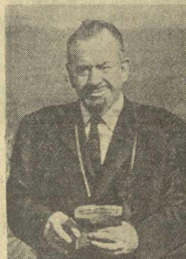
Джон Стейнбек в Тбилиси. Разве не этим чудным любил руководствоваться Горький, критикуя в своих произведениях то, что ему казалось неверным? — добавляет он.

Стейнбек высказал много интересных мыслей о значении писательского творчества, о назначении литературы в развитии общества. В частности, интересно было услышать из его уст мнение о том, что литературу нельзя рассматривать отдельно, в отрыве от жизни. Он также отметил, что любовь к своему народу и борьба за прогресс обязывают писателя быть критическим. В своих произведениях он критикует свою страну и делая это потому, что любит родную американ-