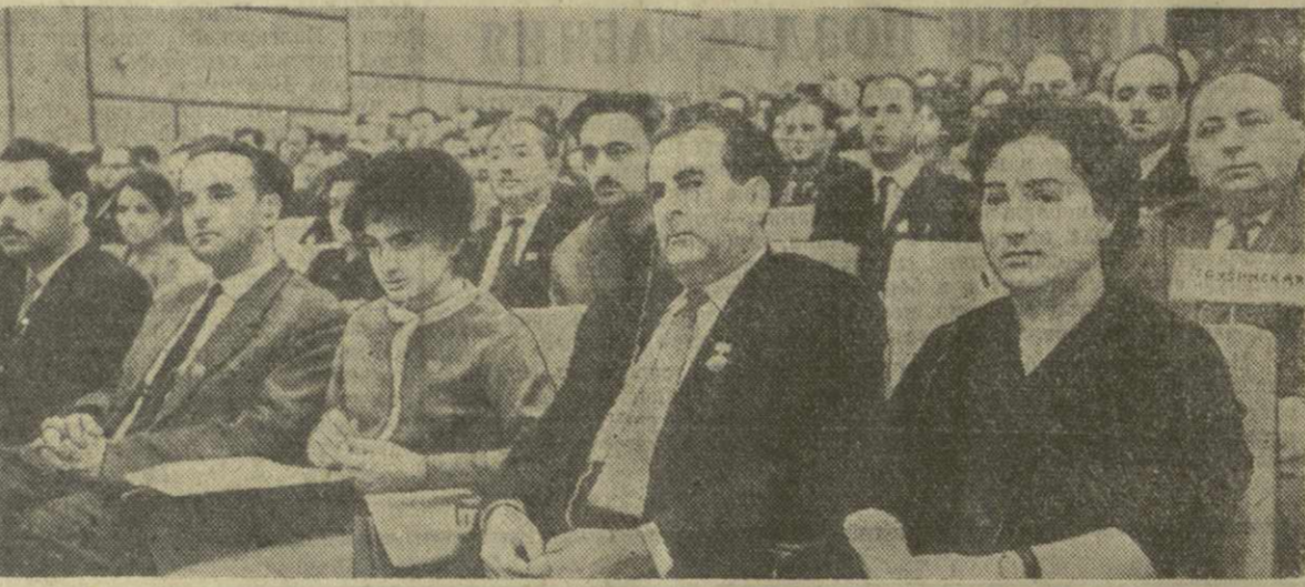
Москва. XIII съезд профсоюзов СССР. На снимке: делегаты съезда из Грузинской ССР в зале заседаний.

И. АРТЕМОВ, В. БЕЛЛЕВ, М. РОЖДЕНСТВЕНСКАЯ, А. СЕРВИН. (Спец. корр. ТАСС). Москва, 30 октября.