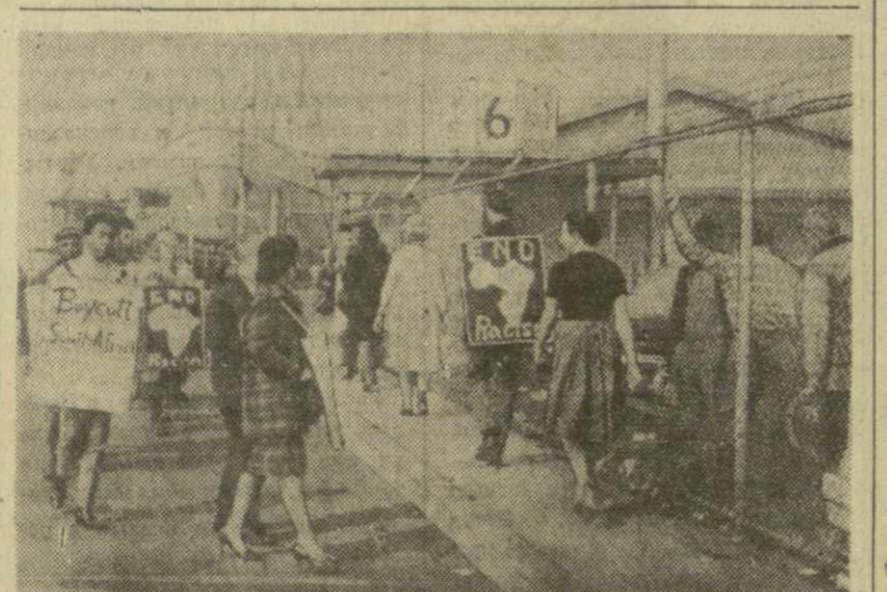
Бесчинства южноафриканских расистов вызывают гнев и возмущение всего мира. Недавно в Нью-Йоркском порту проводилось выкореживание южноафриканского судна. Грузники не пересекли линий вылета. Разгрузка судна была приостановлена. На снимке: участники пикета с плакатами: «Немедленно покинуть с дартендом», «Покончить с расизмом!», «В США и в ЮАР расизм должен быть искоренен!».

За 19 лет в стране построено 70 промышленных предприятий и цехов, 32 предприятия строятся в настоящее время. На их сооружение