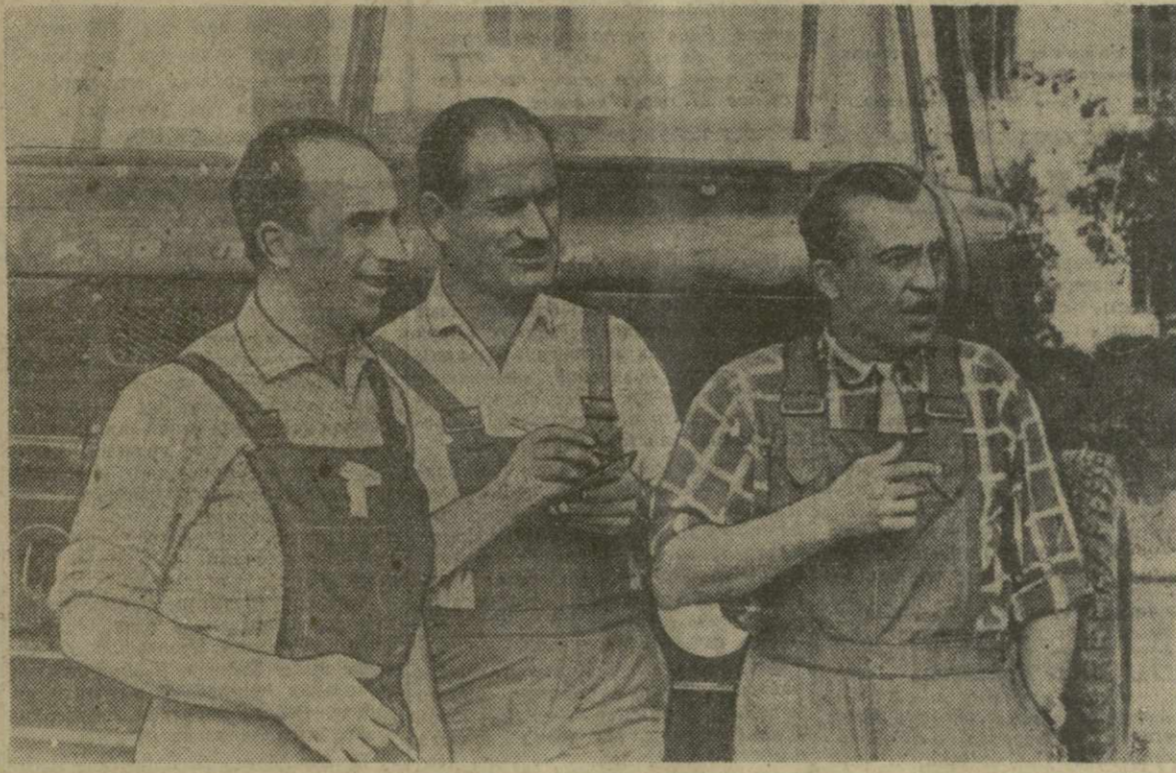
Свыше двух месяцев назад наша бригада обратилась ко всем рационализаторам Грузии с призывом до конца года разработать хотя бы одно предложение по ликвидации тяжелых ручных работ.

Министр обороны СССР, Маршал Советского Союза П. МАЛИНОВСКИЙ.