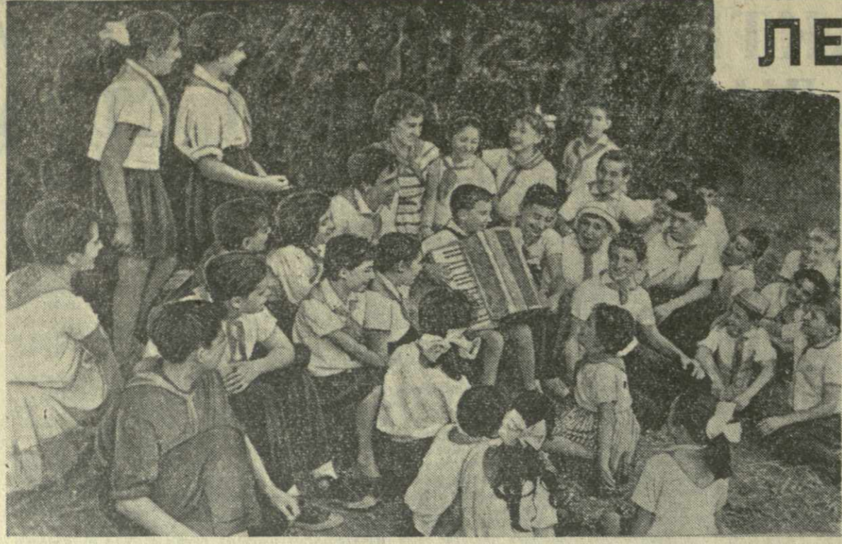
Звонит пионерская песня над совхозными полями.

Сейчас в Ленинграде сооружается еще одна подобная электростанция, которая предназначена для объединения «Красный треугольник». Электростанции без котлов получают права гражданства.