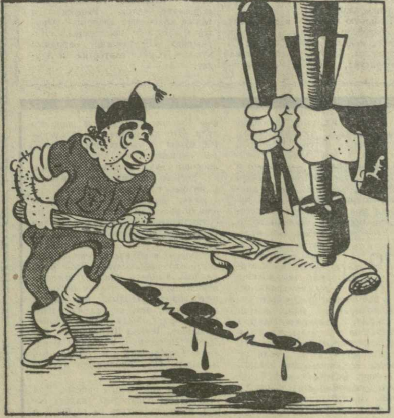
ТОПОРНАЯ СДЕЛКА.