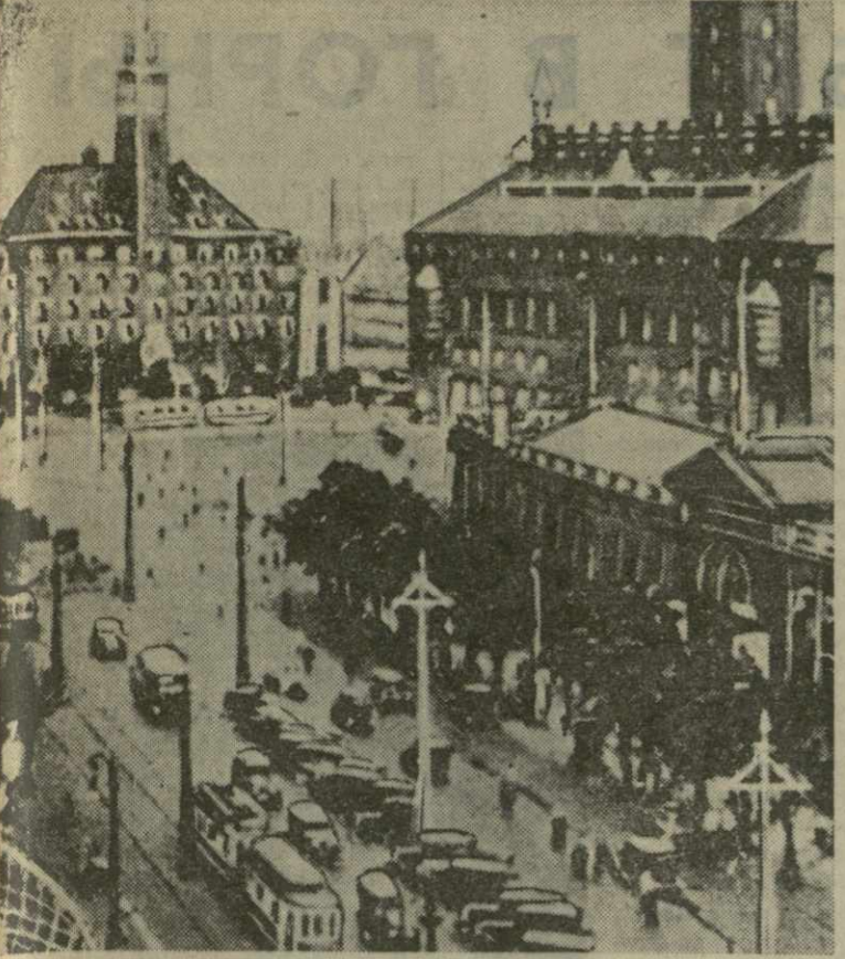
В эти дни древняя столица Дании — Копенгаген особенно нарядна. Здесь готовится к встрече высокого гостя — Председателя Совета Министров СССР Н. С. Хрущева. На снимке: вид на улицу Вестербруге и площадь Ратуши.