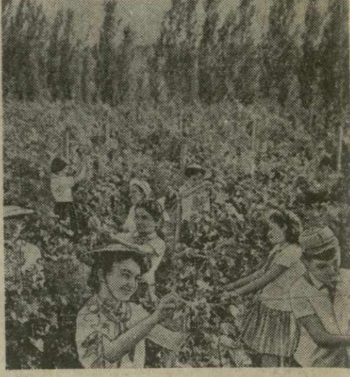
Пионеры помогают работникам совхоза на винограднике.