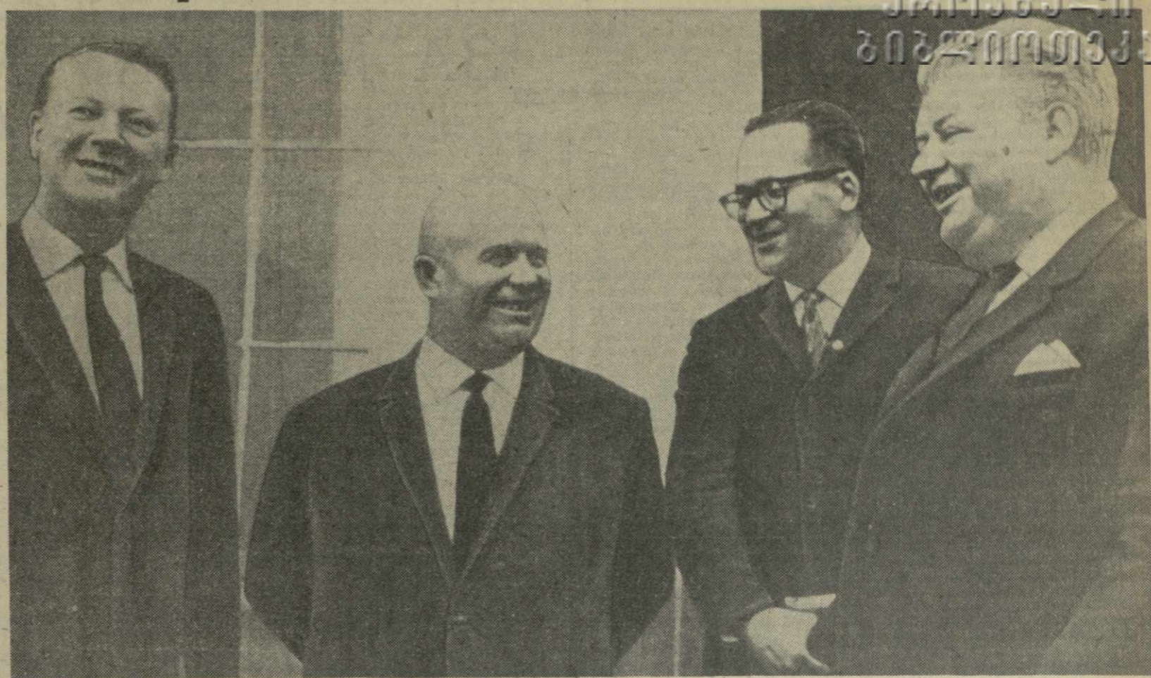
17 июня во дворце Мариенбурге начались переговоры Председателя Совета Министров СССР Н. С. Хрущева с премьер-министром Дании Е. О. Крагом и членами датского правительства. На снимке: перед началом переговоров (слева направо) Е. О. Краг, Н. С. Хрущев, переводчик и министр иностранных дел Дании П. Хеккеруп.