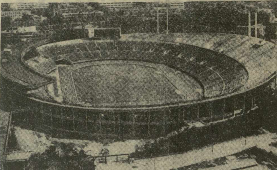
Так выглядит главная арена Национального стадиона в Токио.