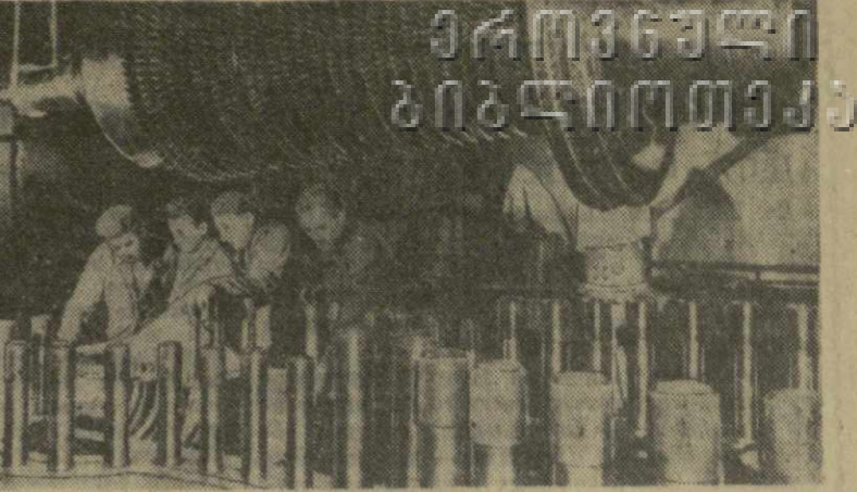
Восточно-Словацкий металлургический комбинат — крупнейшая стройка Чехословацкой Социалистической Республики. Он сыграет решающую роль в резком увеличении производства стали. В 1970 году комбинат будет давать 12 миллионов тонн стали.

Одновременно с месячником в стране идет подготовка к празднованию годовщины чехословакско-советского Договора о дружбе, взаимной помощи и пословенном сотрудничестве, 20-летие которого будет отмечаться 12 декабря.