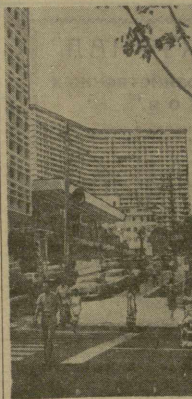
Гавана. Один из новых жилых районов.

Одновременно с месячником в стране идет подготовка к празднованию годовщины чехословакско-советского Договора о дружбе, взаимной помощи и пословенном сотрудничестве, 20-летие которого будет отмечаться 12 декабря.