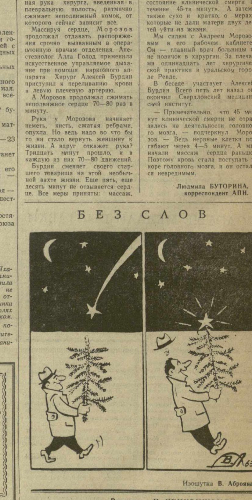
Иллюстрация В. Аброва.