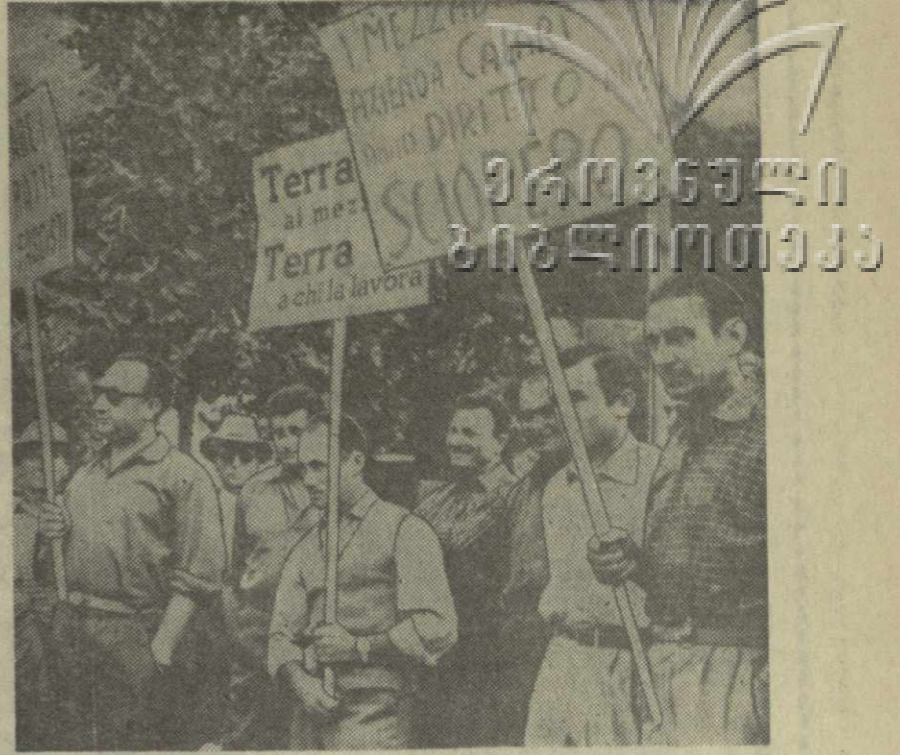
Итальянские крестьяне ведут борьбу против аграрной политики правительства. На снимке: арендаторы провинции Эмилия во время демонстрации. Они требуют снижения арендной платы.