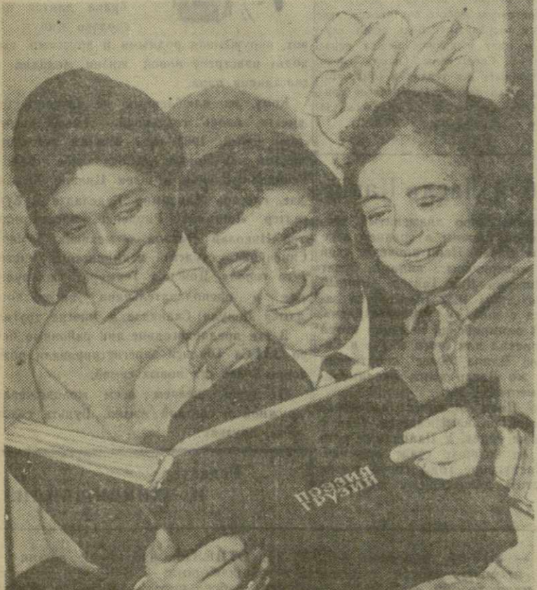
ЛЮБИМЫЕ СТИХИ.