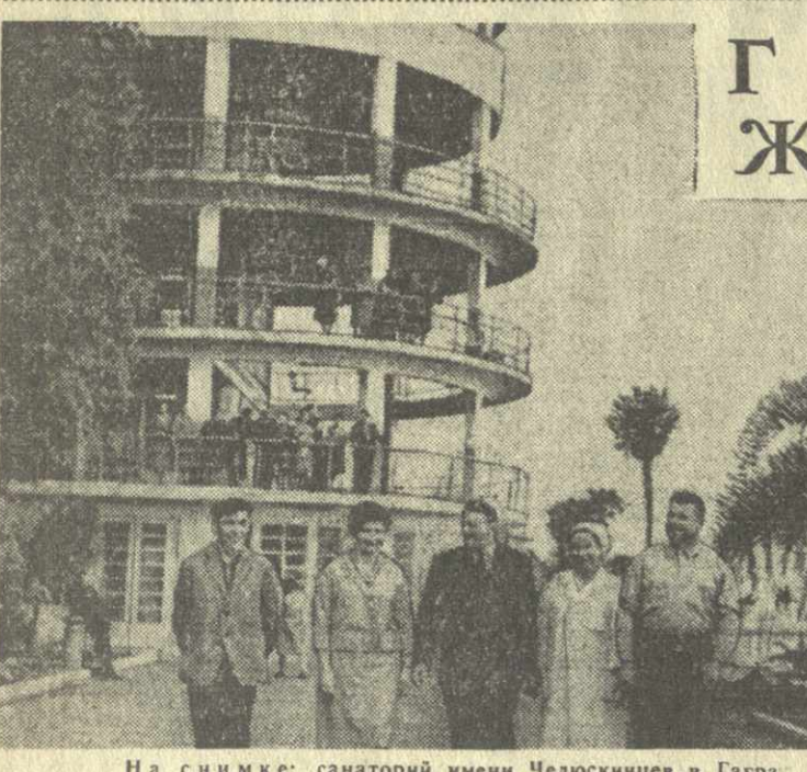
На снимке: санаторий имени Челюскинцев в Гагре.

«Опыты над животными» — пишет газета, — показали, что заболевшее животное выздоравливает значительно быстрее, находясь в электрическом поле. Хан утверждает, что если над постелью человека, больного тяжелой формой гриппа, повесить электрод, то больной выздоравливает примерно за пять часов.