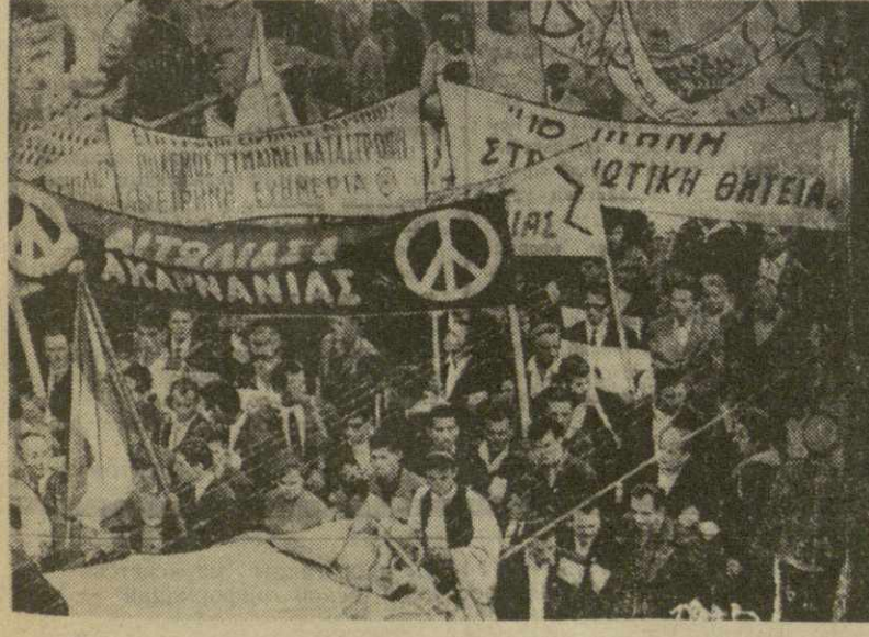
На снимках: слева — греческие патриоты в походе за мир; справа — танки войск НАТО на улицах г. Салоники.

бы советского и греческого народов. Каждый новый танец вызывал бурю аплодисментов, артистов забрасывали цветами, приветствовали дружескими возгласиями. Над трибунами реяли тысячи красных козырьков. Долго не могли наши артисты добраться до своих автобусов: сотни рук тянулись к ним для дружеских рукопожатий, раздавались возгласы: — Приезжайте к нам еще! Друзья! Высоко оценивают греческие театральные рецензенты месячное пребывание в стране ансамбля народного танца Грузии. «Эти гастроль, — пишут они, — имеют для нас определенный смысл, они дают стимул для дальнейшего развития географического искусства Греции». В этих оценках вряд ли есть преувеличение. Начиная с гастроль ансамбля «Вереска», авторитет и популярность советского танцевального искусства поднялись в этой стране на исключительную высоту. Это, кстати сказать, произошло параллельно с падением интереса зрителей к широко рекламируемому, но убогим по содержанию и качеству выступлениям многочисленных американских гастролеров. Греческая общественность страстно жаждет сейчас много, подлинного искусства. Здоровые тенденции неуклонно, через все преграды, пробивают дорогу, помогая развитию культурной жизни страны. Гастроль грузинских артистов — важная веха на пути этого развития. Афины — София, Июнь, 1964 г.