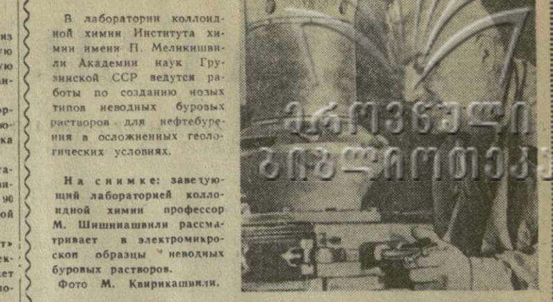
В лаборатории коллоидной химии Института химии имени П. Меллишвили Академии наук Грузинской ССР ведутся работы по созданию новых типов неводных буровых растворов для нефтедобычи в осложненных геологических условиях.

Если один «Ионокрафт» расположить в 1,100 километрах к западу от Нью-Йорка, а другой — в 1,100 километрах к востоку от Лос-Анжелеса, то, по словам изобретателя, он обеспечит прямую радио- и телевизионную связь между этими двумя городами. Подобным же образом можно установить связь с Европой, расположив один «Ионокрафт» над Гренландией, а другой — над Исландией.