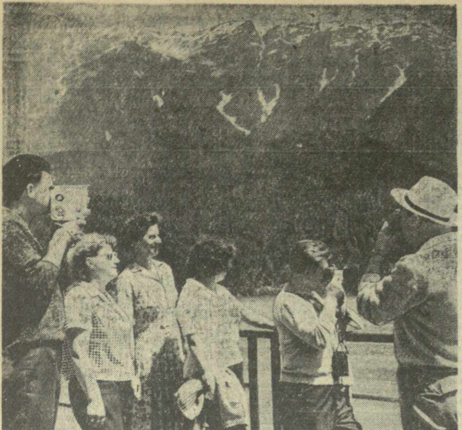
Сотни машин с туристами и отдыхающими из здравниц Черноморского побережья ежедневно держат путь к высокогорному озеру Рина. Недавно здесь побывали туристы из ГДР, совершающие поездку по СССР на теплоходе «Абхазия».