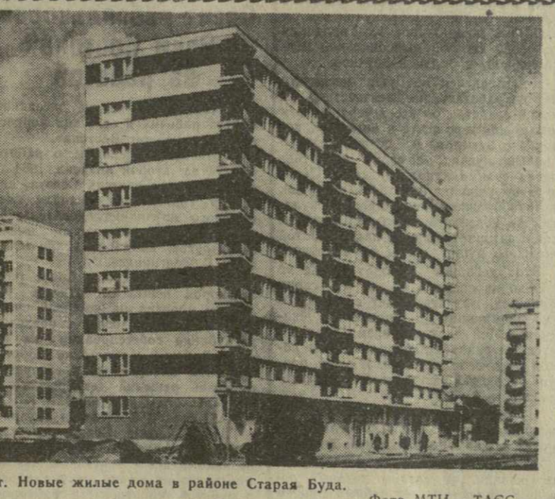
Будущее. Новые жилые дома в районе Старая Буда.

Уже более трех лет сотрудники Института экономики и права Академии наук Грузинской ССР работают с рабочими Тбилисского автосовхоза-аэровокзального завода и швейной фабрики № 1. На этих предприятиях ученые проводят конференции, читают лекции по актуальным вопросам экономики производства. Большую помощь оказывает институт рабочим и служащим ТВЗ в повышении квалификации. Несколько человек с завода с помощью сотрудников института работают сейчас над диссертациями.