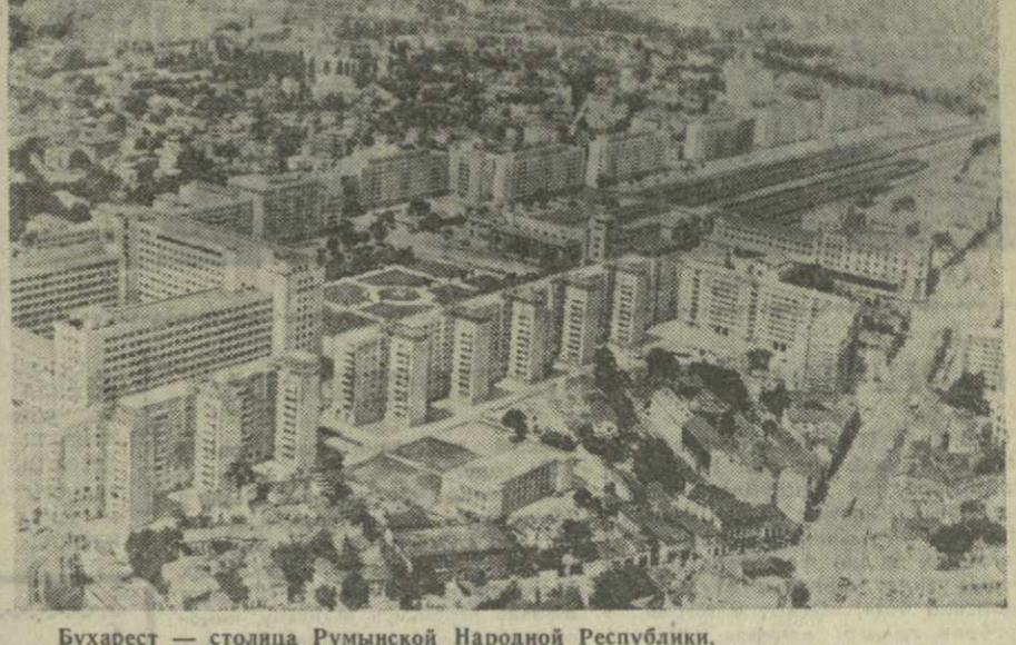
Бухарест — столица Румынской Народной Республики.