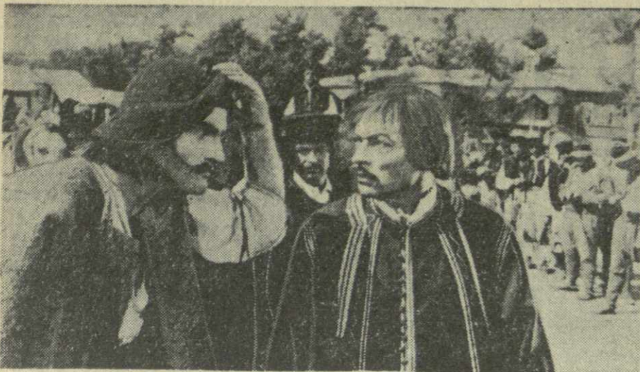
На снимке: кадр из кинофильма «Тудор».

Проведение кинофестивалей — хорошая, славная традиция. Она помогает наладить личные контакты между кинодеятелями разных стран, расширяет наш творческий кругозор.