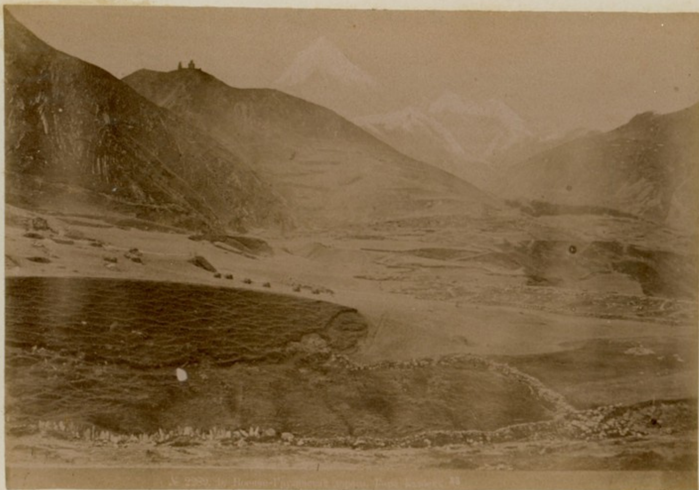
Гора Кавдери • Вид со станции Раздери