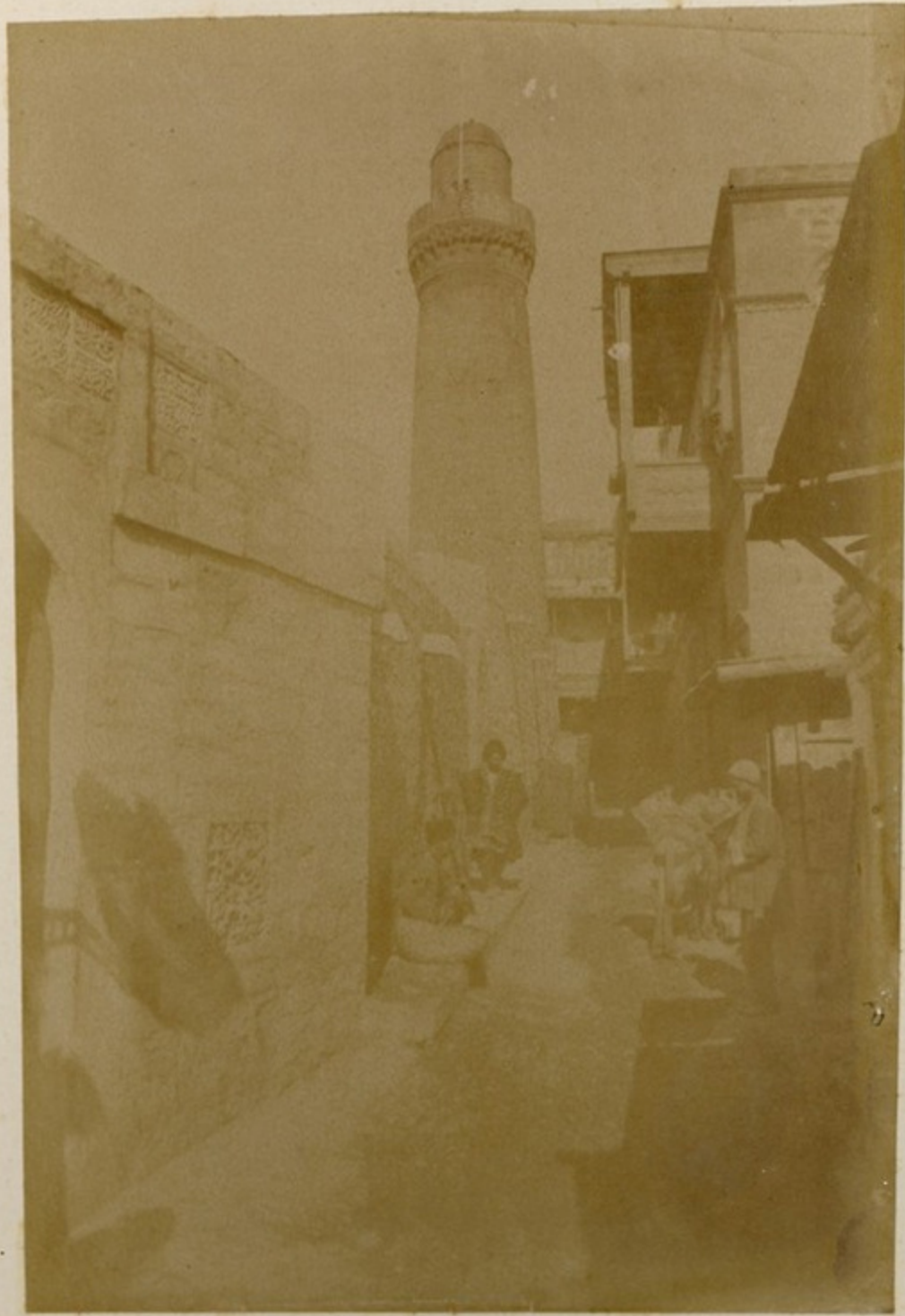
Київ. - Улиця в Кривоносець.