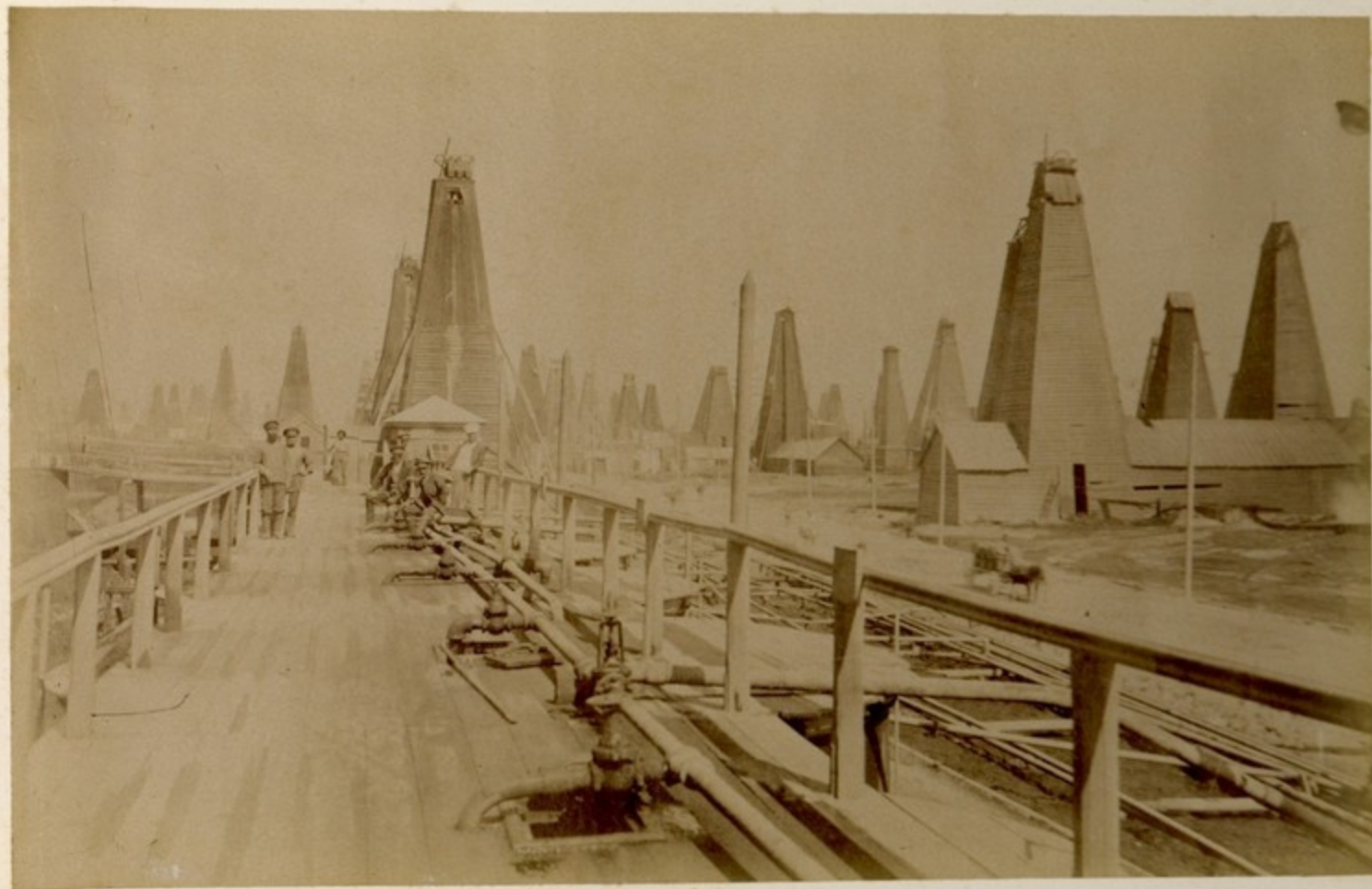
Cary. - Camaxani