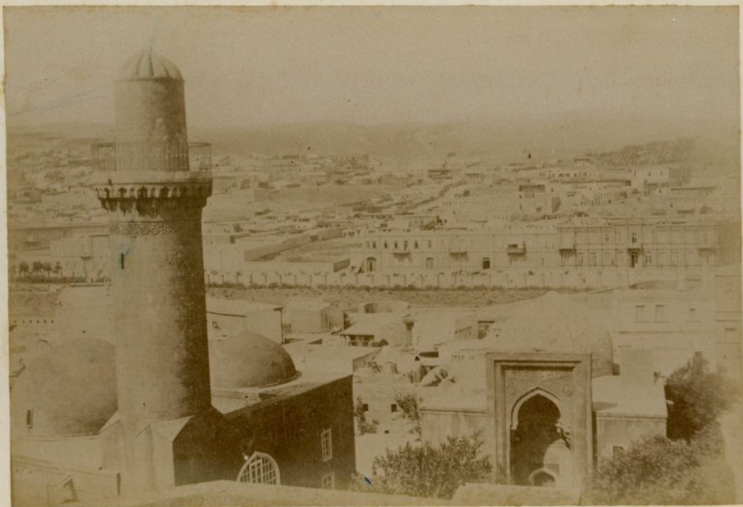
Тифли. Бугра or Кривоноетли.