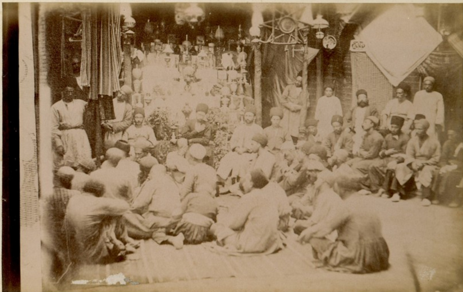
Мусулманский праздник в Стамбуле.