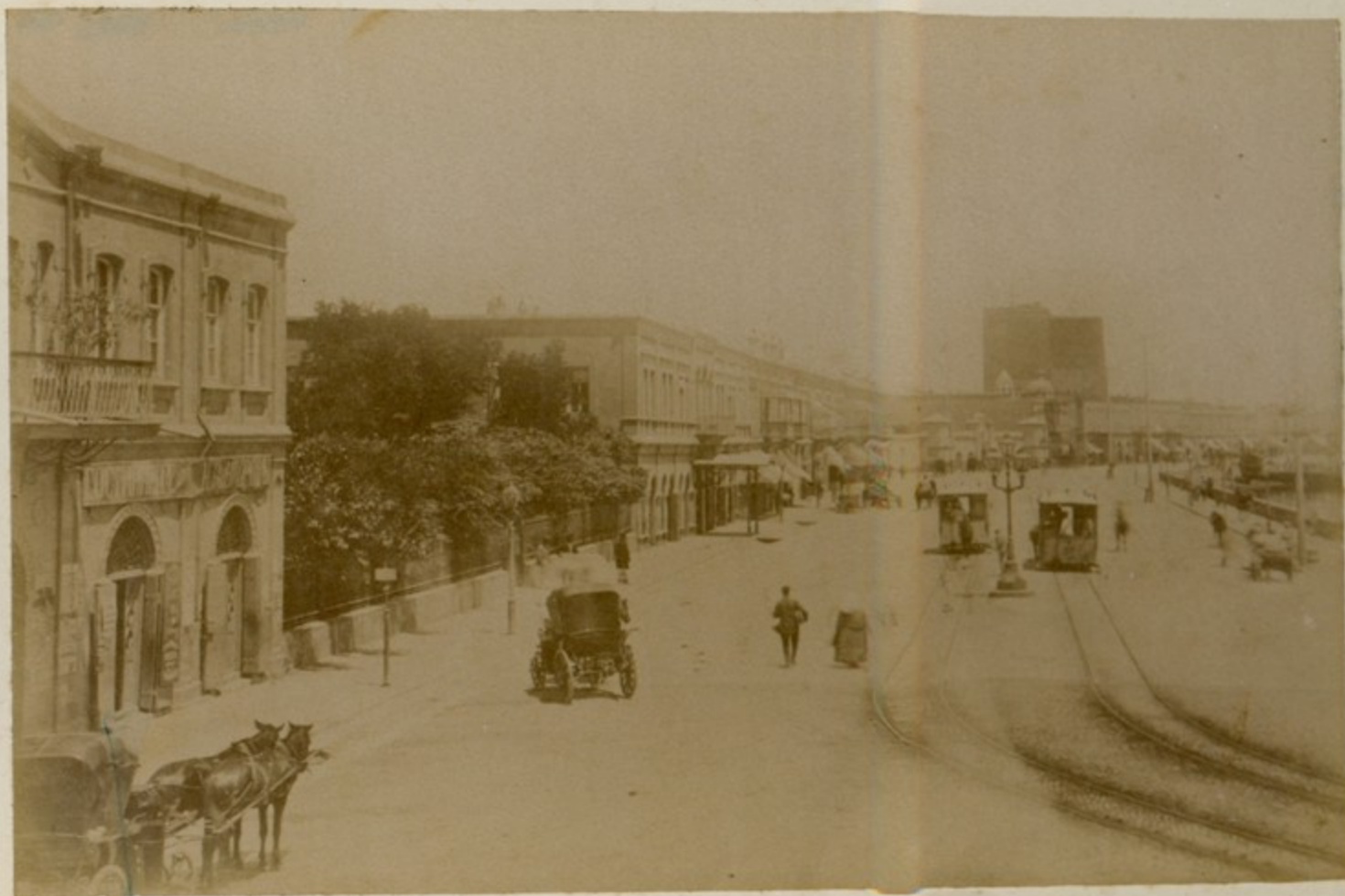
Тбилиси. - Визитная карточка.