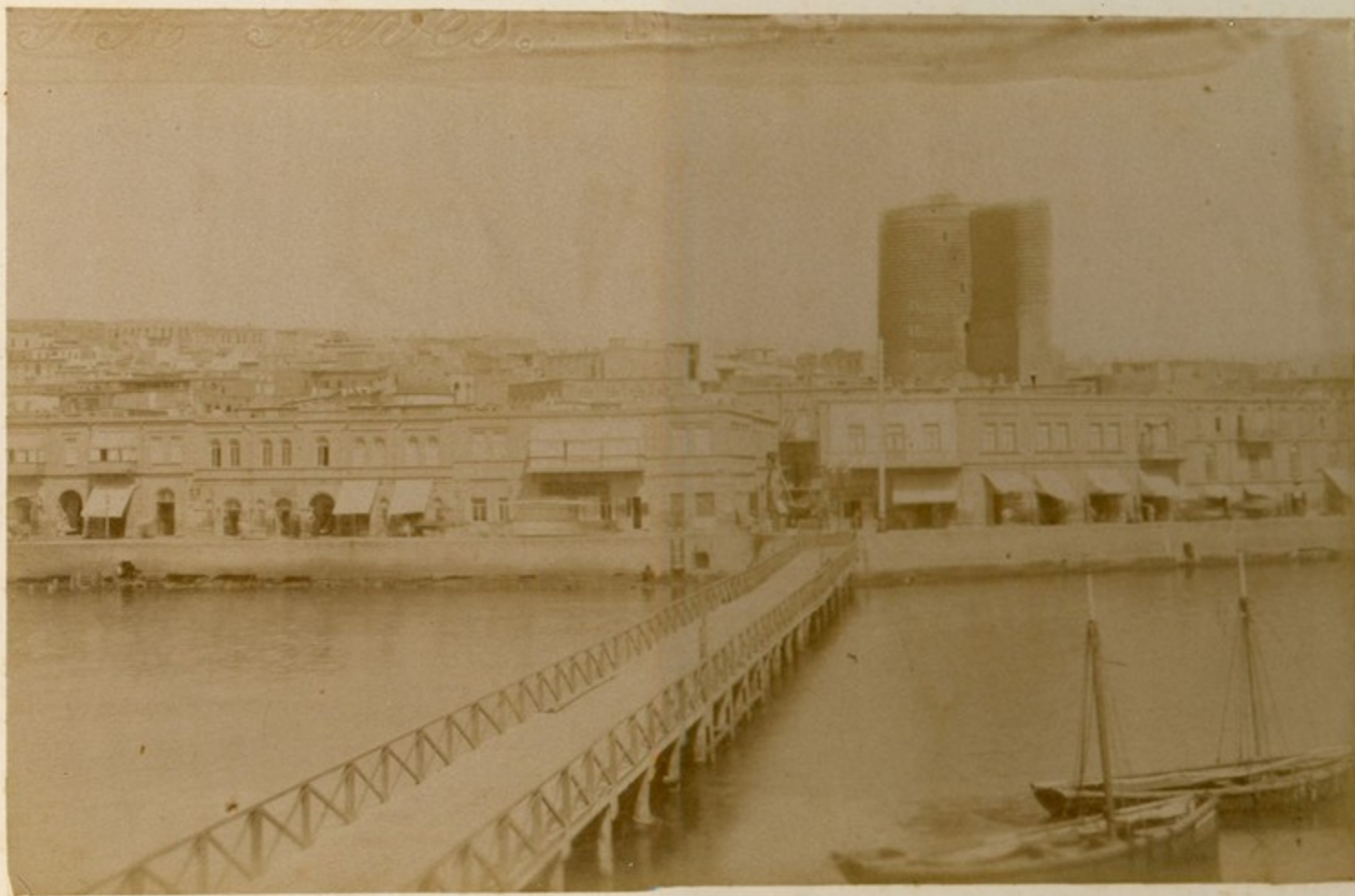
ბათუ. Видъ надъ набережною съ мостика.