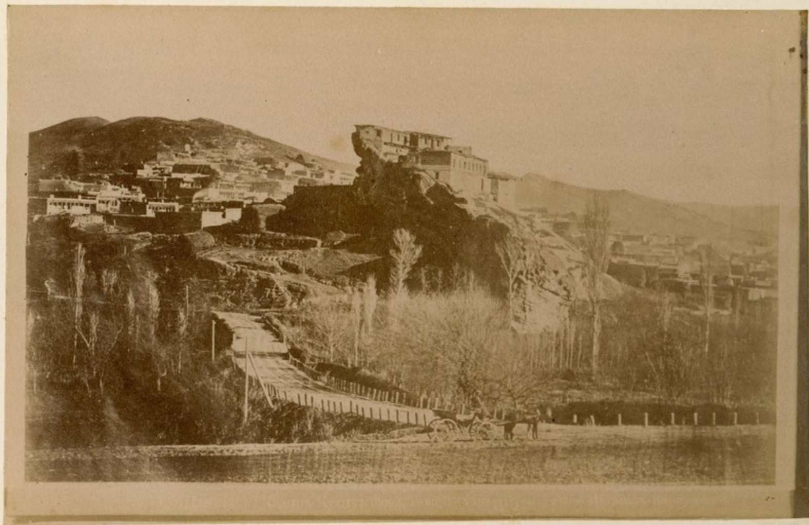
ხედი აქედან მდინარეზე და ქალაქსა