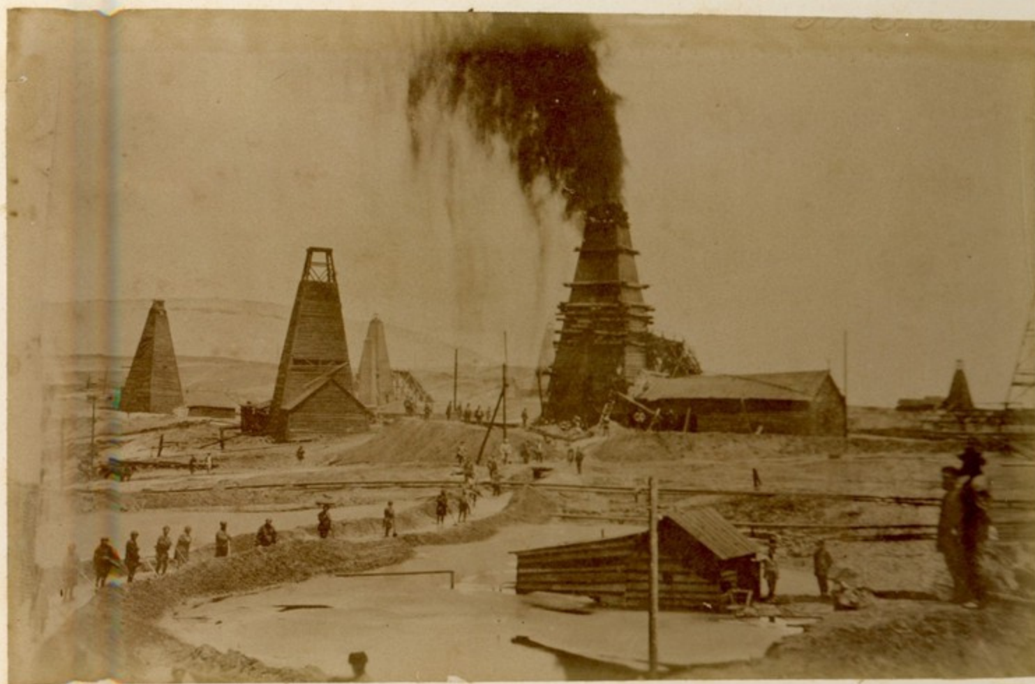
ჭარუ. - ფონთან ბ. ბარყანაძე