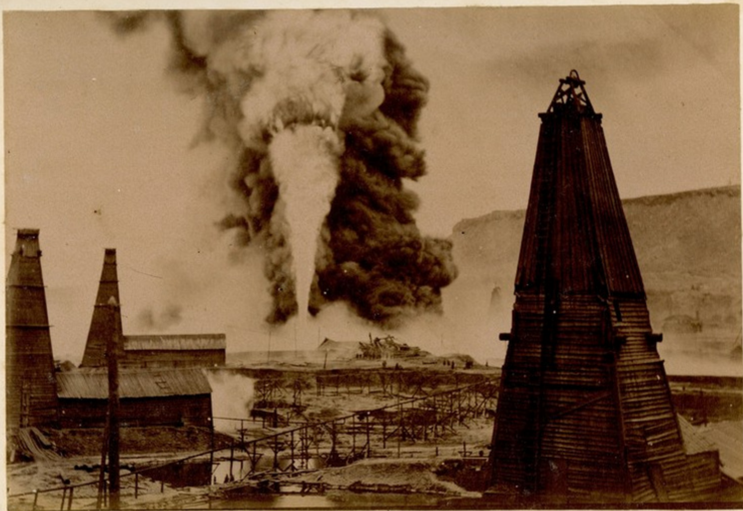
Горы. Горной гонимой Гоммульга в Буди- Дубини, сгоревшей в 1897 году.