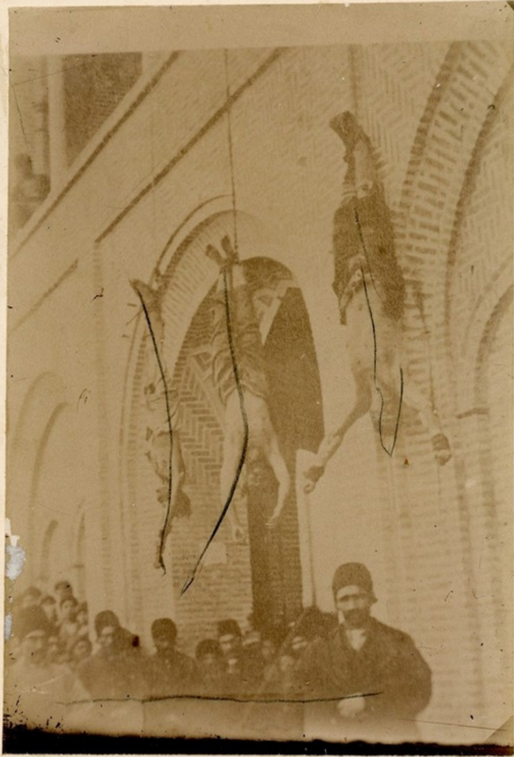
Казнь у пещерин