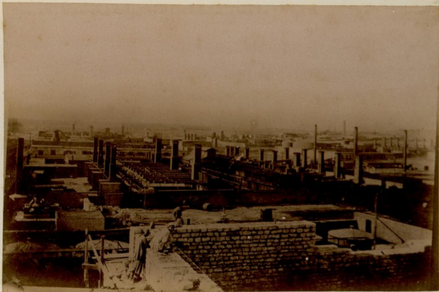
ბაყუ. - შერმაინ რობოტ.