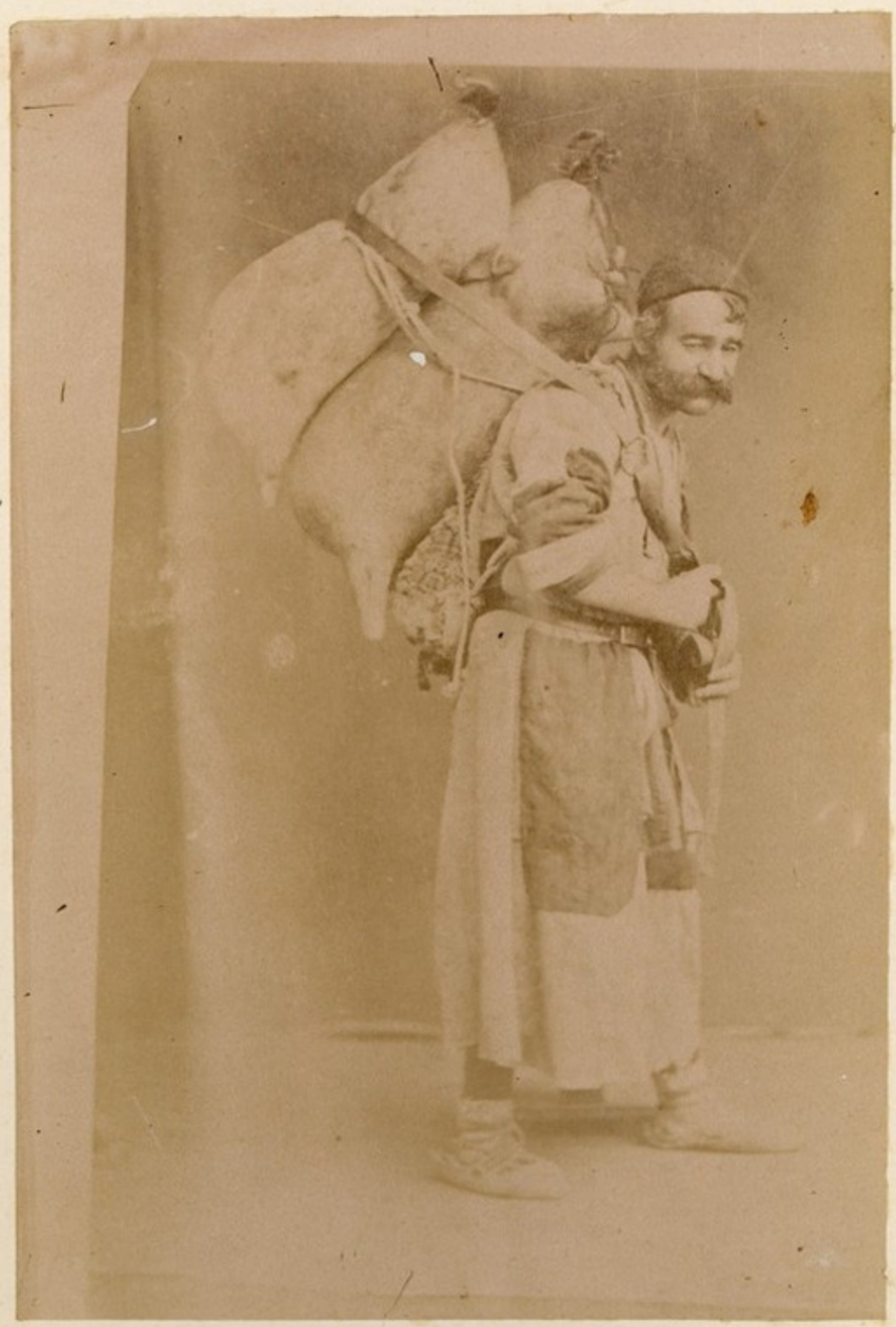
მონაქვი და მონაქვიანი