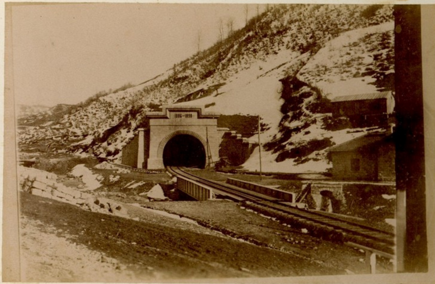
Кавказ. туннель при дороге