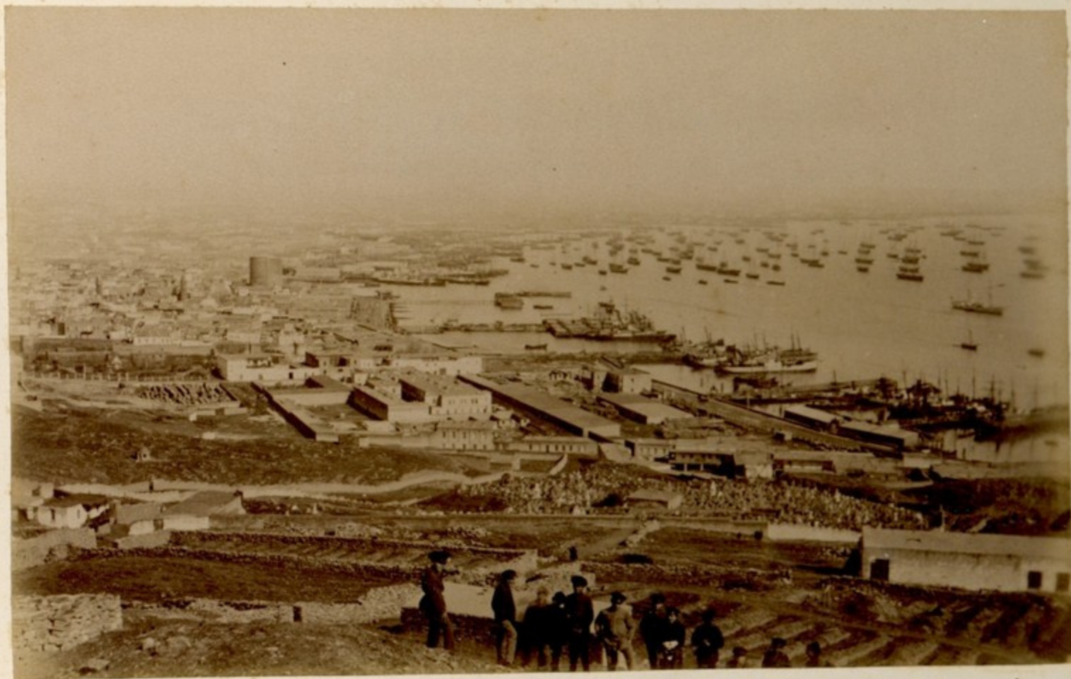
ბათუ. ვიდეო კლაგვილი