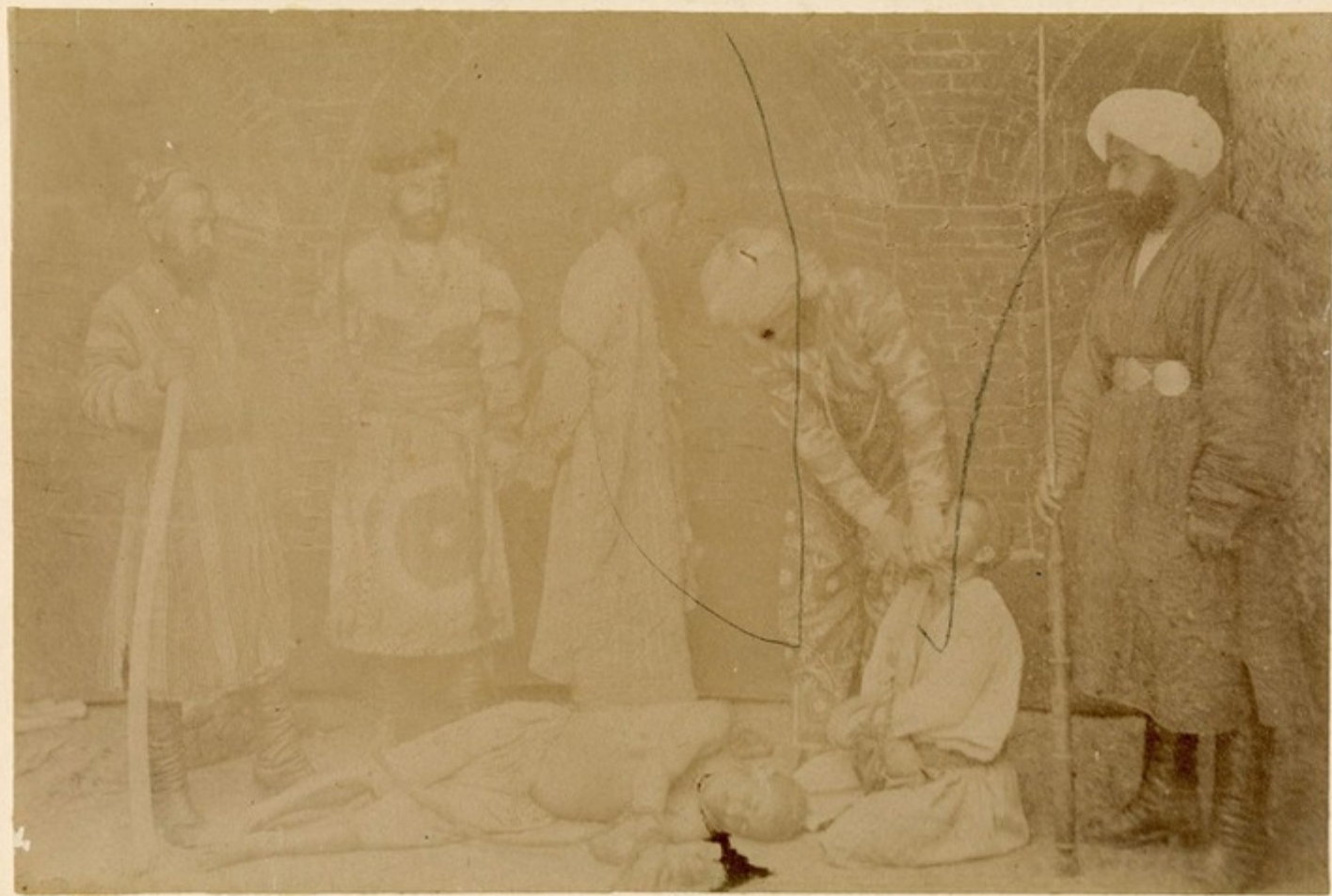
Казнь у персиян.