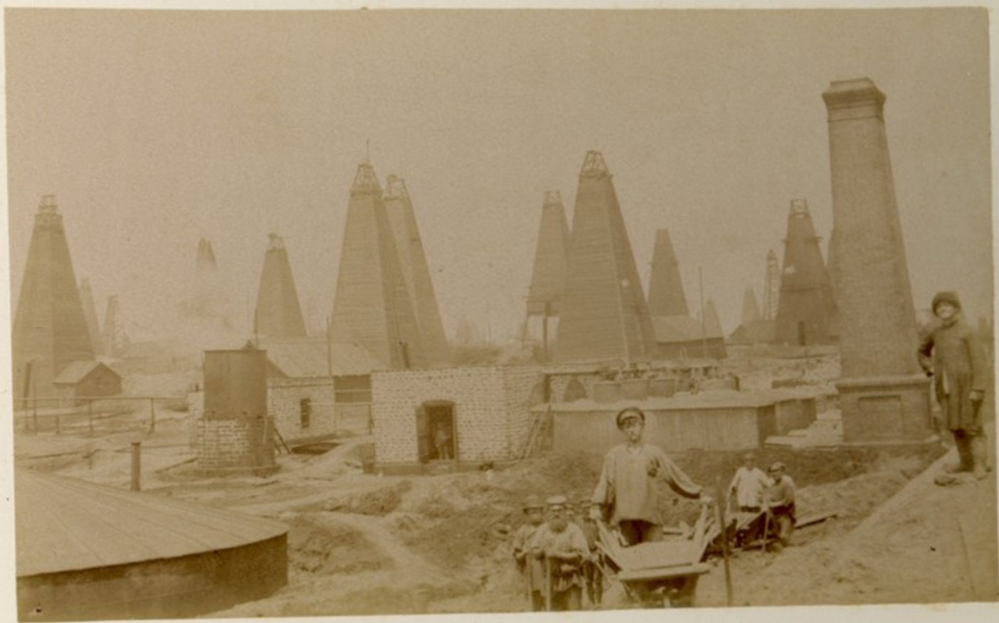
ბარჯ. - ბარჯანი.