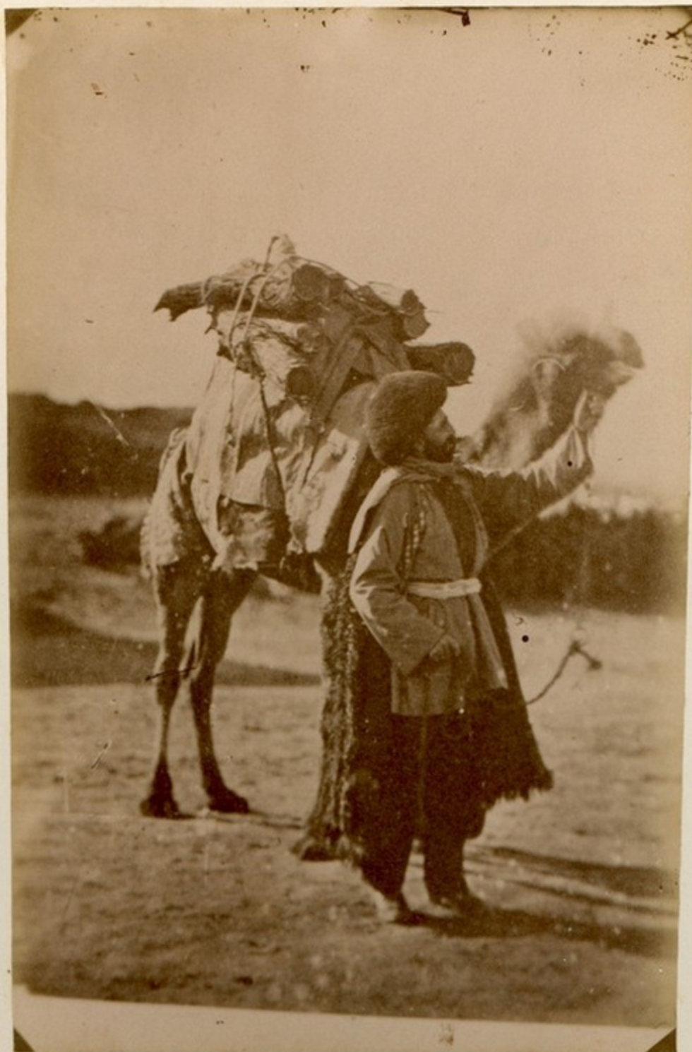
Персианцы с верблюдами