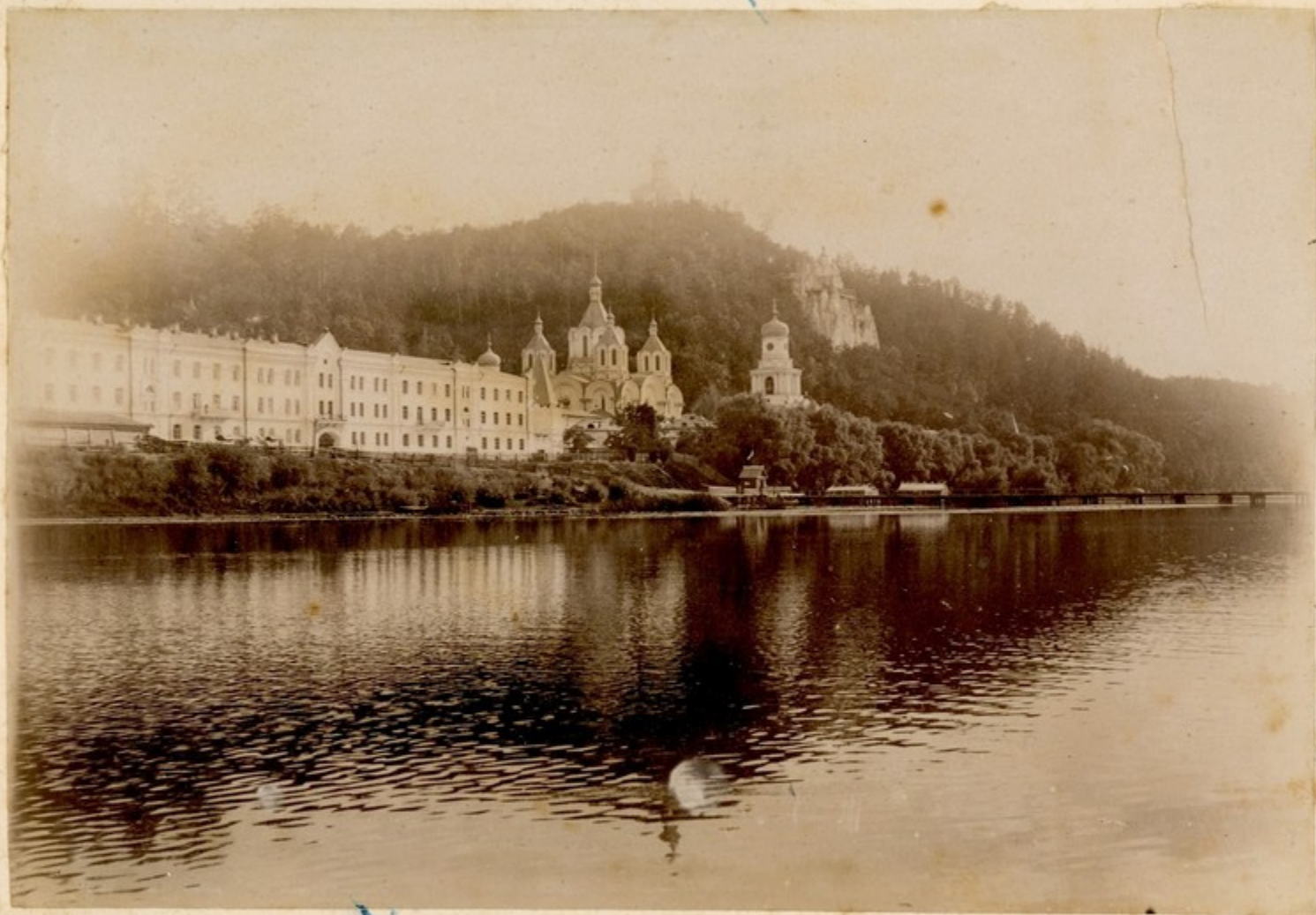
Holy Apollonia Monastery of Kabartse.