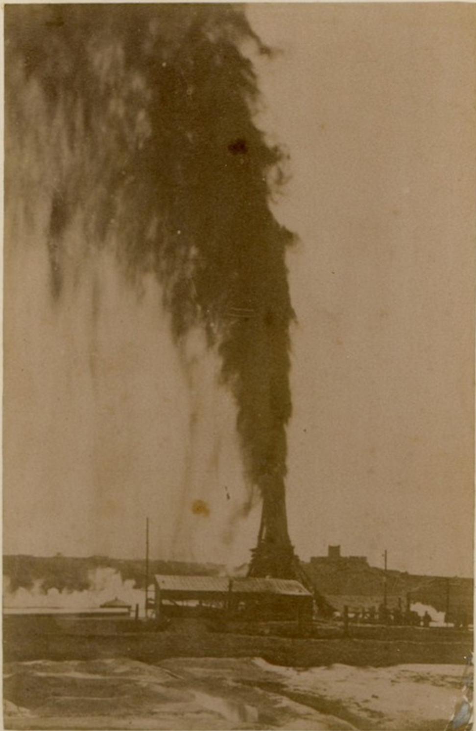
ბაყ. ჰერმონის კონტაქტ ბ. ბანაყანაძე.