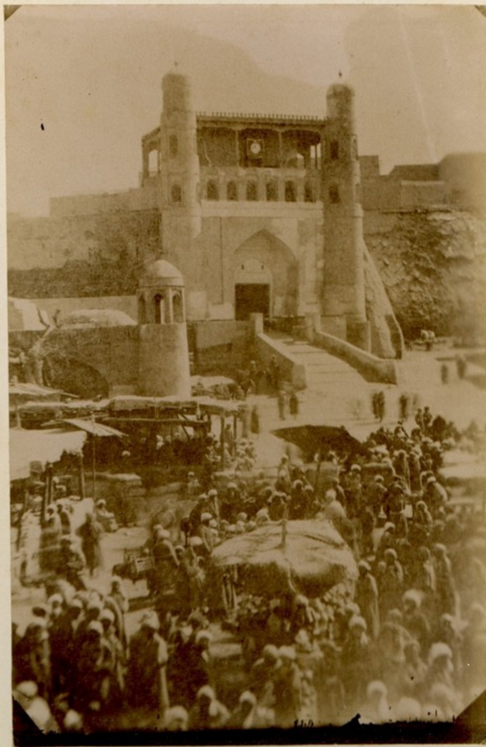
ტყვარა. ავღოსტოვს დროს ტყვარაში