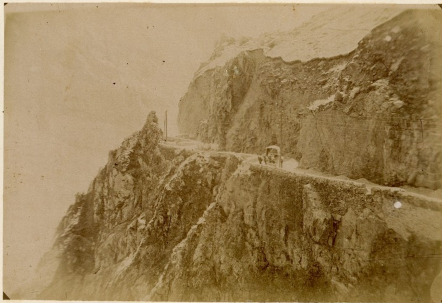
კაბრეასი, ბოენო ტყუანერასი დოგროდი.