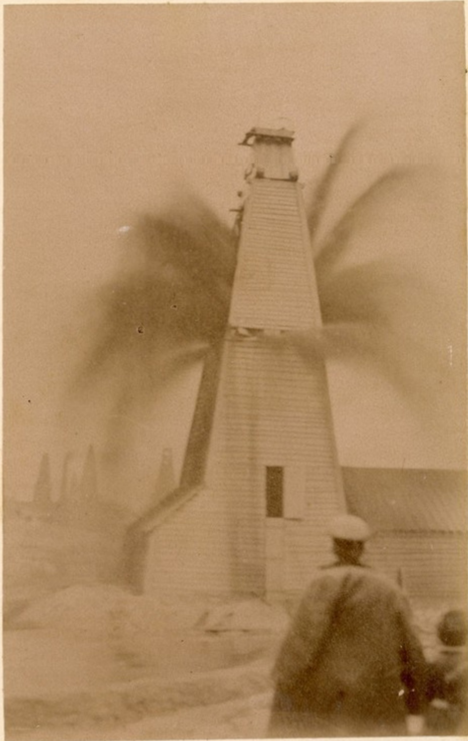
Кертманской гонимой, закры- той сверху. — во Балу.