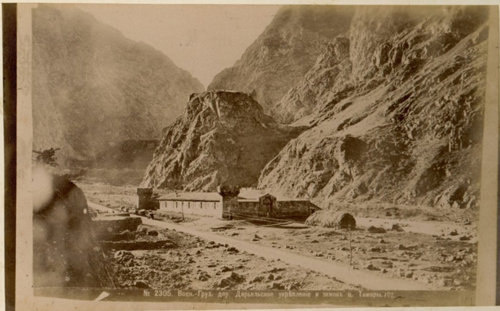
Дарьяльское ущелье и Замок Мамары