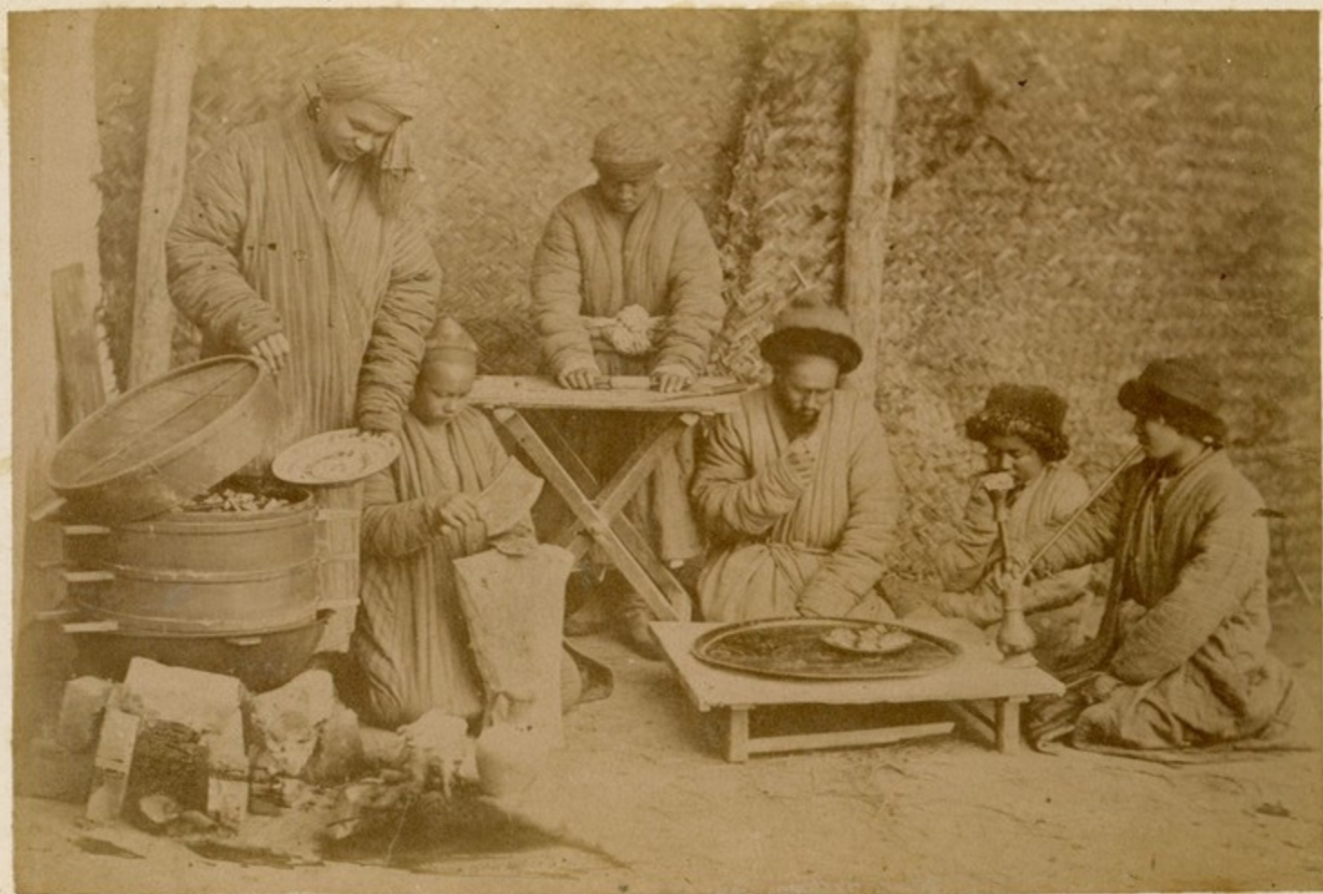
ზუგდიდის მამარაშვილის კუხარი.