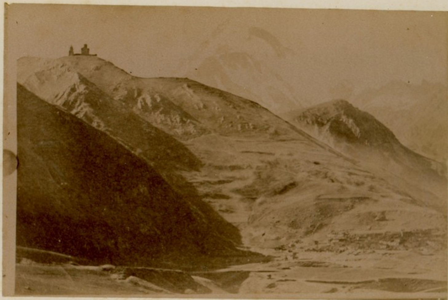
საბრაჯი. ზოგა მარბერი.