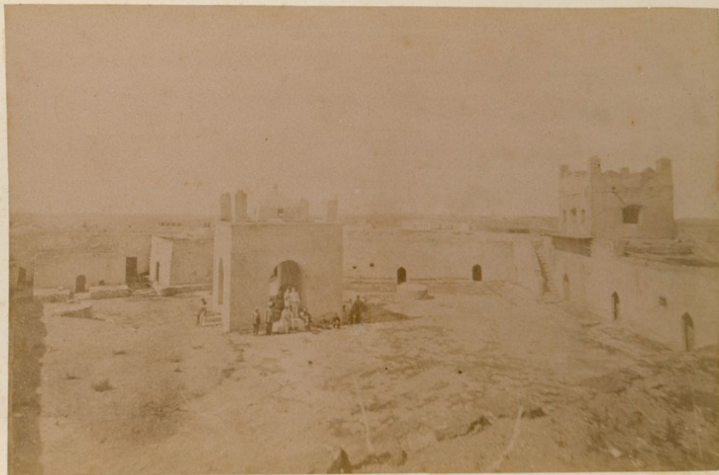
ბაგრატიონების სასახლე. ნაგებობის მთავარი შესასვლელი.