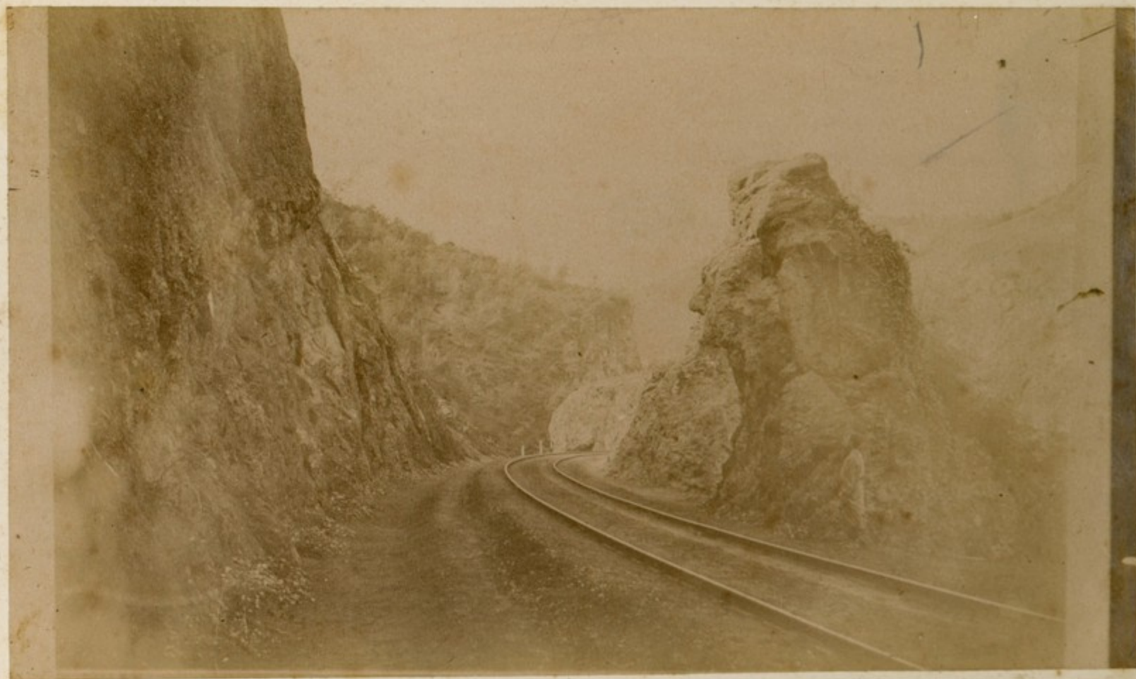
ქვემოთკახეთის გზის სანაპიროები.