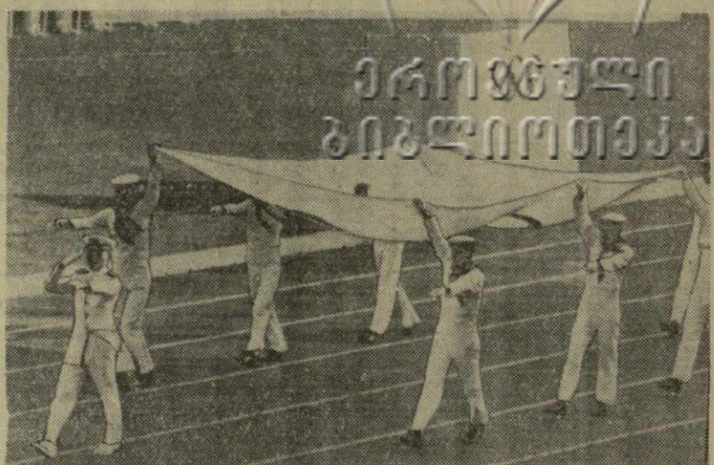
Вчера в Токио. Вынос олимпийского флага на открытии XVIII Олимпиады.

Вчерашний матч на первенство страны по футболу между командами «Крылья Советов» (Куйбышев) — «Волга» (Горький) закончился ничью — 1:1.