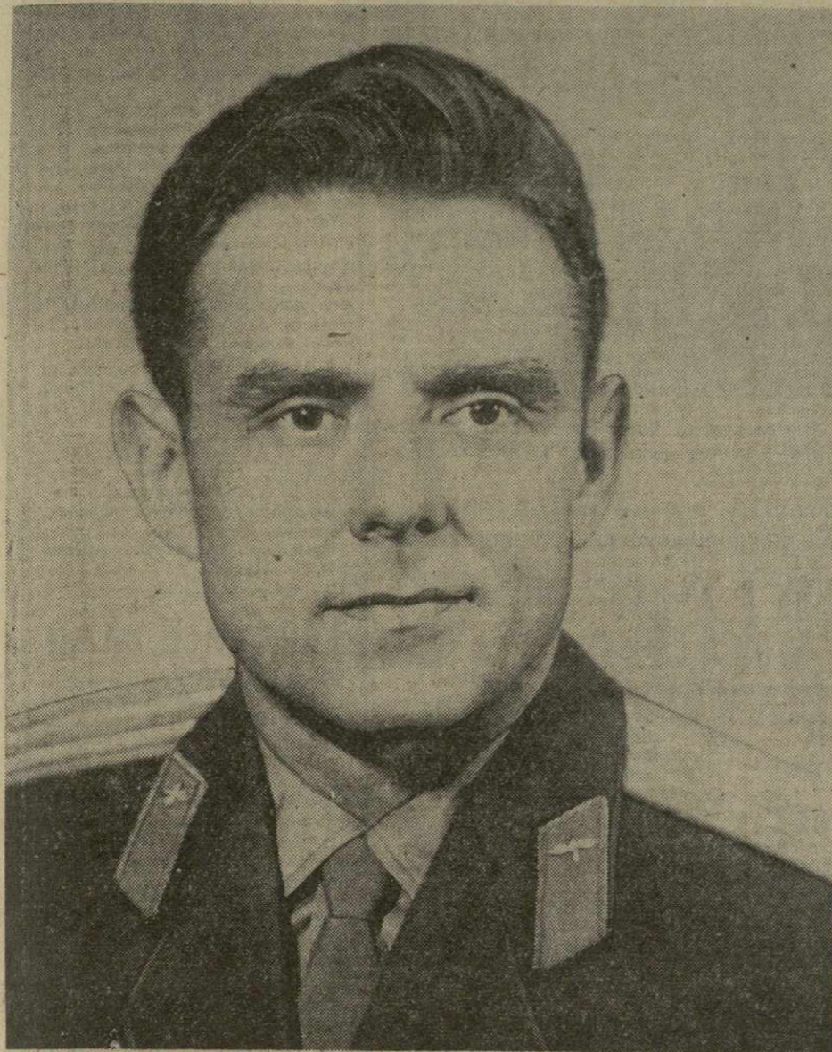
Космонавт Владимир Михайлович КОМАРОВ.

Материалы, полученные в результате полета, обрабатываются.