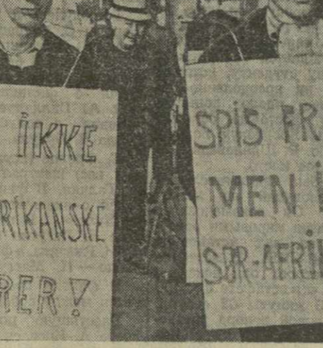
Многие тысячи норвежцев выражают возмущение расистской политикой аппарата, проводимой правительством Ферура. 18 норвежских организаций призвали жителей Осло не покупать товаров из Южно-Африканской Республики. И с ними же: пикет противников расизма на улице Осло. Плакаты гласят: «Не покупайте южноафриканских товаров», «Восточные фрукты, но не южноафриканские».