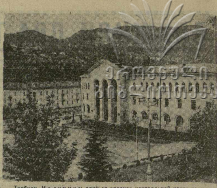
Тбилиси. На с ним к: один из уголков центральной части города.

В ознаменование 100-летия со дня основания медицинского общества Ученый совет Министерства здравоохранения Грузинской ССР. Совет научно-медицинских обществ республики провели юбилейные заседания своих периферийных обществ. А сегодня в Тбилиси начат свою работу юбилейная научная сессия, в которой примут участие ученые Грузии, Азербайджана, Армении и других республик.