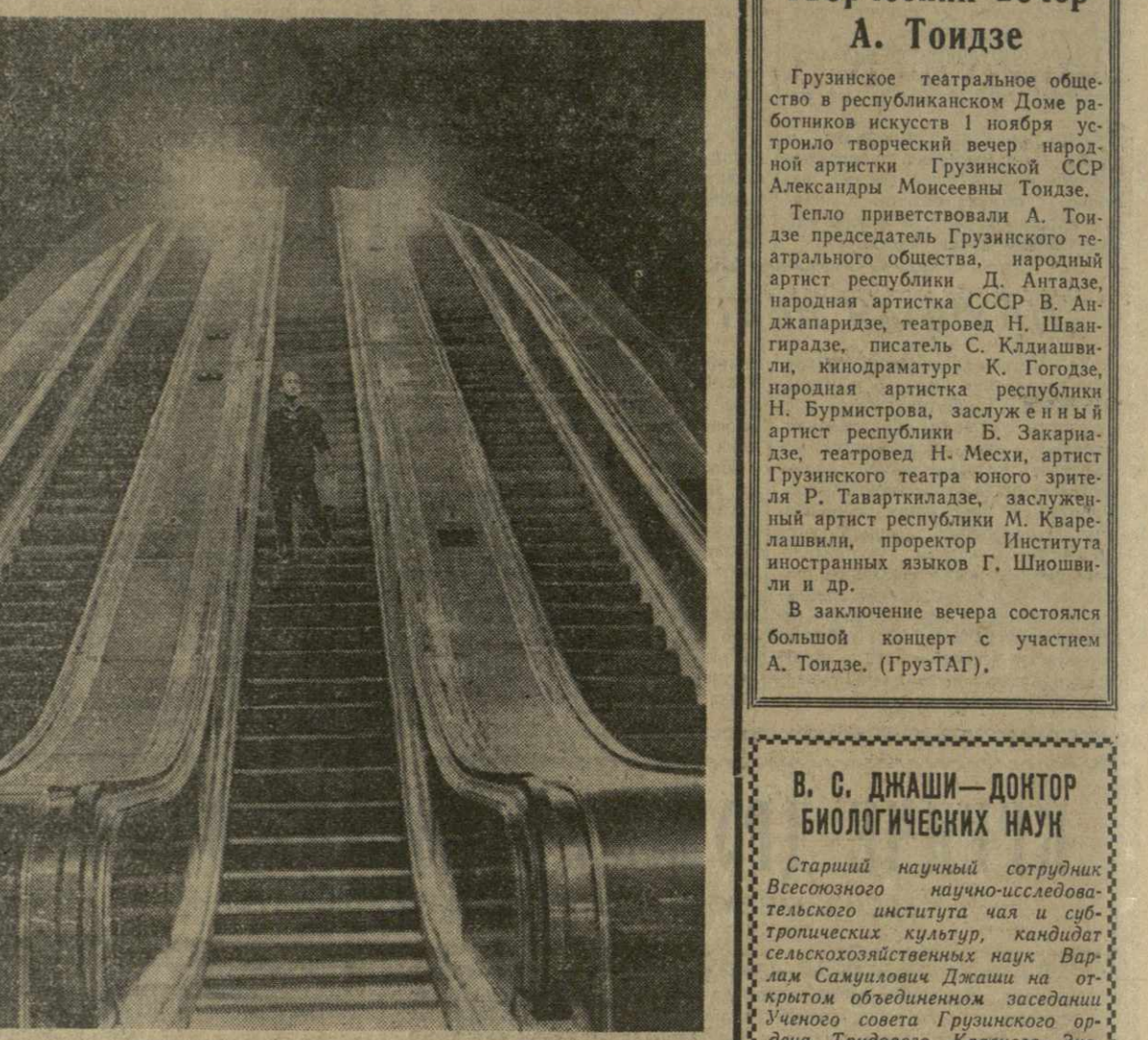
На снимке, сделанном нашим фотокорреспондентом М. Квирикашвили, вы видите сияющий огнями эскалатор метро. Снимок сделан в Москве, Киеве или Ленинграде. Этот эскалатор находится в Тбилиси, на станции Октябрьская. Ее строительство уже закончено. Закончены отдельные работы и на станции «Площадь Марджанишвили». Первая линия Тбилисского метрополитена — дело совсем недалекого будущего. Подземная трасса протянется через весь город — от Грмаге до моста 300 аргангитов. На некоторых участках уже зяеят рельсы от бегущих по ним поездов. Правда, это пока груженные породой вагонетки, но они как бы прокладывают путь пассажирским вагонам. Начало строительства многоэтажного здания диспетчерского пункта. Он станет сердцем Тбилисского метрополитена, его «мозговым центром». Глубоко под землей идет незымая для тбилисцев работа — прокладываются рельсы, одеваются в гранит платформы.

На днях киностудия «Союзмультфильм» прислала на просмотр грузинским кинематографистам шесть своих новых картин. Красочные и разнообразные, они привлекли внимание своей тематикой и мастерством. «Топтышка» — так называется забавная история для малышей о дружбе зайчонка и медвежонка, созданная режиссером Ф. Хитрури. Веселую сказку братьев Гримм «Храбрый портыжак» сняли режиссеры В. и З. Бруберг по сценарию кинорежиссера М. Волынина, автора киномюзикла «Веселые ребята». Режиссер — И. Аксентук снял фильм «Дядя Степа-милиционер» по известному всем мальчишескому творению С. Михалкова. Ежегодные просмотры новых картин — традиция грузинской киностудии и киностудии «Союзмультфильм». В ноябре этого года картина режиссера В. Бахтадзе «Нарцисс» будет просмотрена и обсуждена в Москве коллективом киностудии «Союзмультфильм». Г. ДЕМИРХАНОВА.