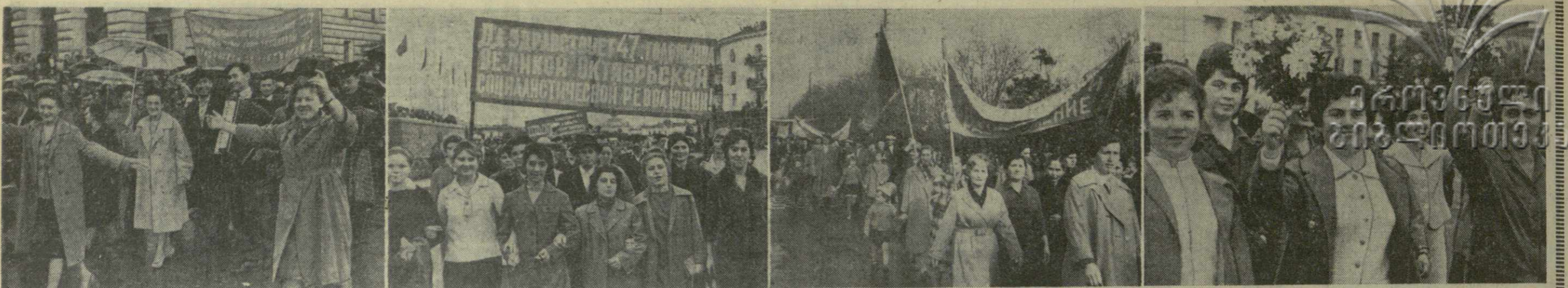
7 ноября 1964 года. Трудящиеся Грузии торжественно отметили 47-ю годовщину Великого Октября. На снимках (слева направо): праздничная демонстрация трудящихся в городах Сухуми, Батуми, Цхинвали и Кутаиси.