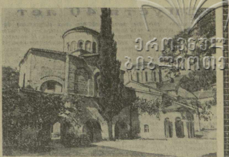
Первый кадр на болгарской земле — Петрицианский монастырь.