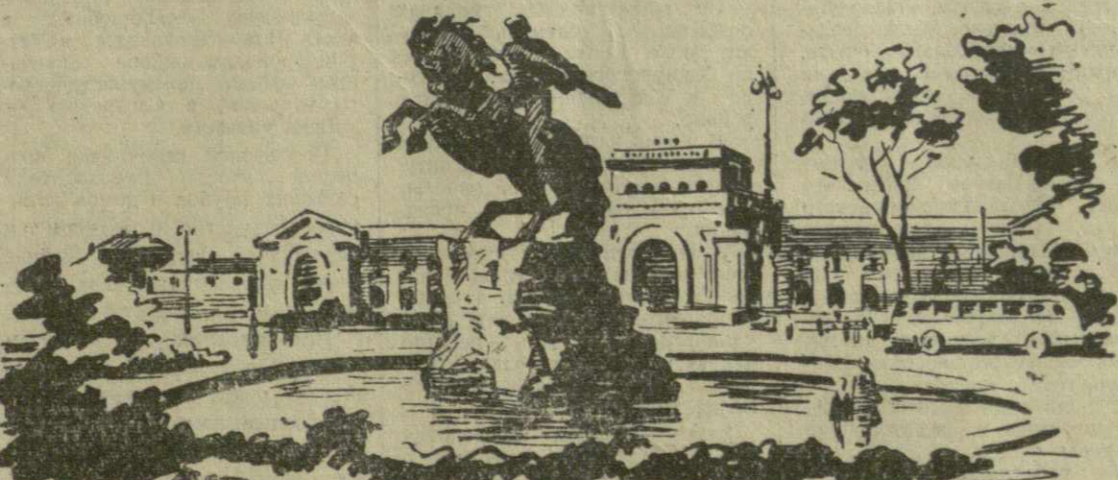
Ереван. Памятник Давиду Сасунскому на приокзальной площади.