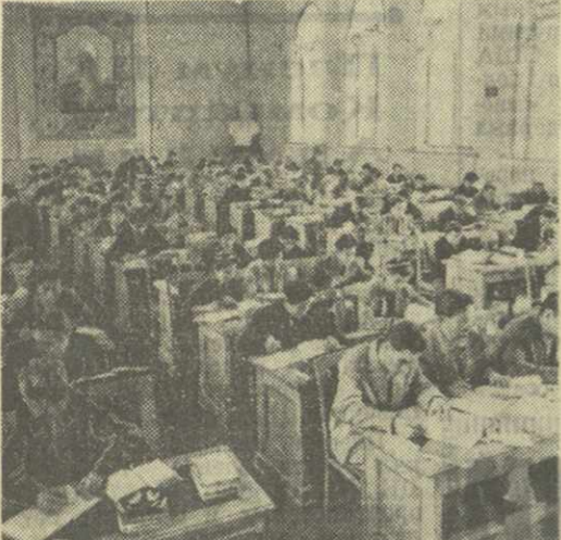
Таджикская ССР. Государственная публичная библиотека имени Фирдоуси в Душабе — одна из крупнейших в республике. В ее книгохранении насчитывается свыше полутора миллионов экземпляров различных изданий.

На снимке: один из читальных залов библиотеки имени Фирдоуси.