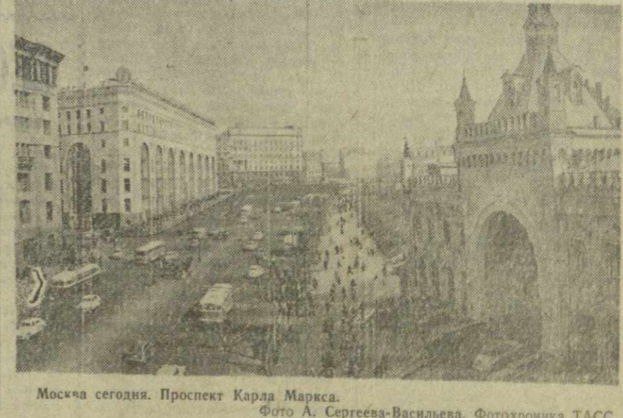
Москва сегодня. Проспект Карла Маркса.

Эхо войны. Занятия в московской школе № 126 закончились, и здание опустело, когда школьный звонок позвонил в милицию. Он сообщил дежурному, что рядом со школой, на бульваре Карбышева, обнаружена бомба.