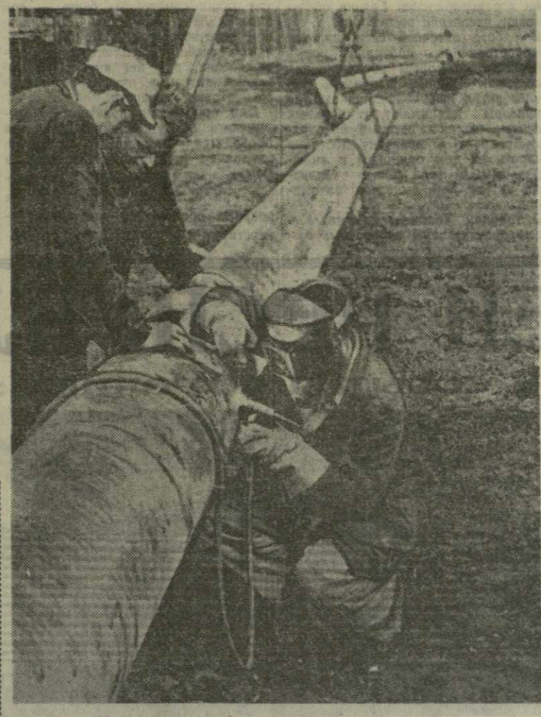
Ежегодно в Германской Демократической Республике вступают в строй участки новых газопроводов. Бурно растет потребление газа в промышленности и коммунально-бытовом хозяйстве.

НЬЮ-ЙОРК, 3 декабря. (ТАСС). Сегодня на утреннем заседании XIX сессии Генеральной Ассамблеи ООН начался общеполитическая дискуссия. Выступивший первым представителем Бразилии Васко Лейтао да Кунья подчеркнул заинтересованность Бразилии в сохранении и укреплении мира, в достижении контролируемого разоружения и в развитии мировой торговли.