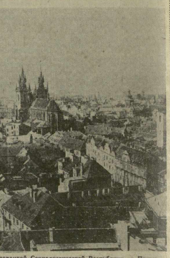
Столица Чехословацкой Социалистической Республики — Прага.