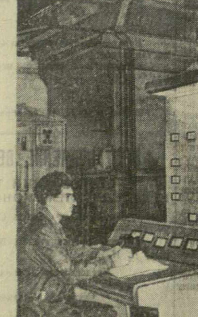
В дни, когда в столице нашей Родины — Москве проходила пятая сессия Верховного Совета СССР, трудящиеся Грузии, как и трудящиеся всей страны, порадовали Родину новыми успехами в борьбе за досрочное выполнение программ шестого года семилетки. Коллективы предприятий промышленности, транспорта и строки, передавая производствоза от них в день рапортов о своих трудовых победах. Сегодня мы публикуем некоторые из этих рапортов, сообщаящих о досрочном завершении заданий 1964 года.

Сухумские химики решили до конца года выпустить сверхплановой продукции еще на 50 тысяч рублей и сэкономить дополнительно 10 тысяч рублей.