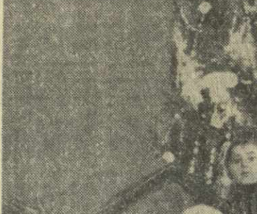
Юго-Осетии. Много подарков получают ребята на праздниках.

На снимке: театральное представление «Волшебная елка» в Тбилисском Дворце спорта.