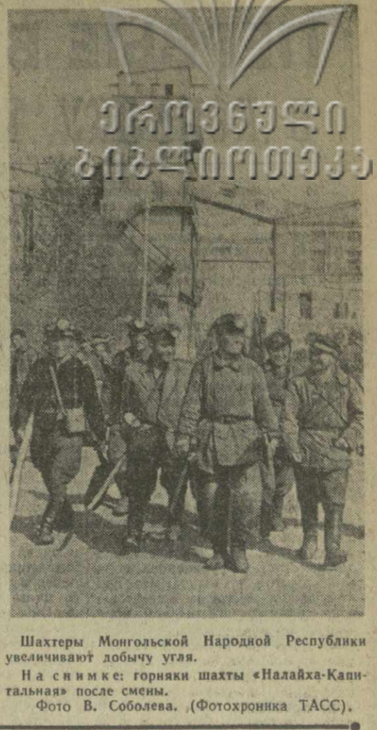
Шахтеры Монгольской Народной Республики увеличивают добычу угля. На снимке: горняки шахты «Налайха-Капитальная» после смены.