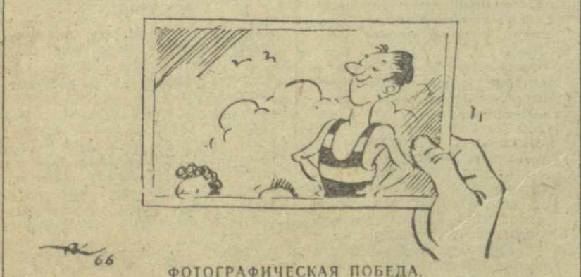
ФОТОГРАФИЧЕСКАЯ ПОБЕДА. Рис. А. Канделаки.