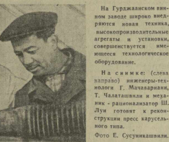
На Гурджанском винном заводе широко внедряется новая техника, высокопроизводительные агрегаты и установки, совершенствуются имеющиеся технологические оборудование.

Каждый руководитель кружка и семинара ведет дневник. В нем есть «Страничка резервов произ-