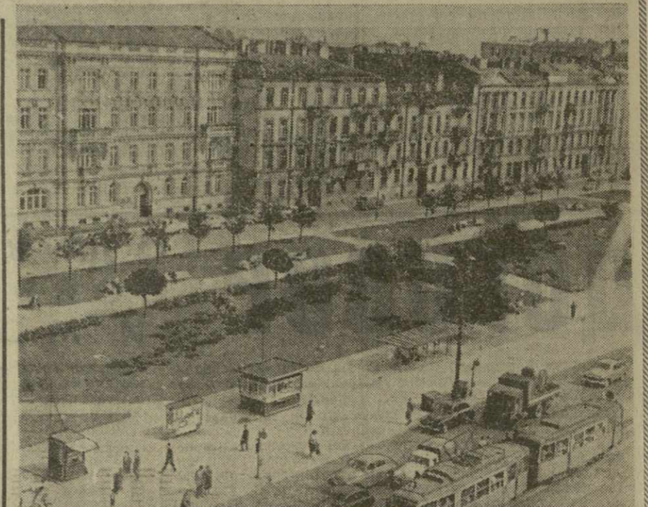
17 января исполнился 21 год со дня освобождения Варшавы Советской Армией совместно с Войском Польским. За последние годы город возродился. Восстановлены исторические здания, построены жилые районы и архитектурные ансамбли. На снимке: одна из главных улиц польской столицы — Иерусалимская аллея.

Национальный совет КПИ приветствовал итоги встречи в Ташкенте.