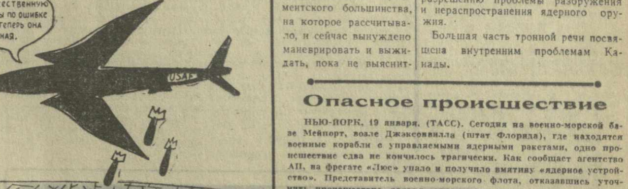
В Южном Вьетнаме, как сообщает иностранная печать, американская авиация по ошибке бомбила «дружественные» деревни, где находились сайгонские партизанские войска.