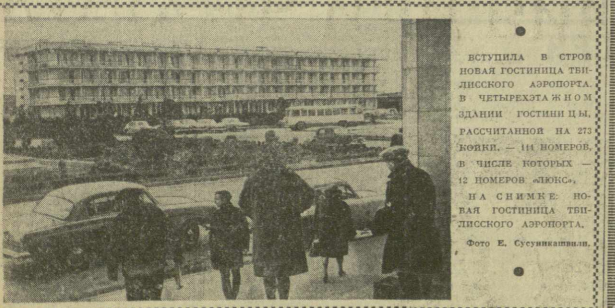
ВСТУПИЛА В СТРОЙ НОВАЯ ГОСТИНИЦА ТБИЛИССКОГО АЭРОПОРТА. В ЧЕТЫРЕХЭТАЖНОМ ЗДАНИИ ГОСТИНИЦЫ, РАССЧИТАННОЙ НА 273 НОМЕРОВ, — 11 НОМЕРОВ, В ЧИСЛЕ КОТОРЫХ — 12 НОМЕРОВ «ЛЮКС». НА СНИМКЕ: НОВАЯ ГОСТИНИЦА ТБИЛИССКОГО АЭРОПОРТА.