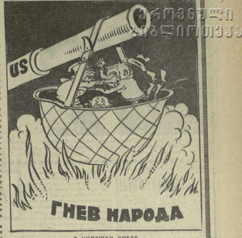
ГНЕВ НАРОДА. Рис. А. Канделаки.

В будущем надо найти выход из этого положения. Премьер-министр указал на необходимость заселения обширных сельскохозяйственных районов страны, особенно в провинции Камагуэй, где очень хорошие природные условия. Для этого, сказал он, жилищное строительство надо развивать прежде всего в сельской местности.