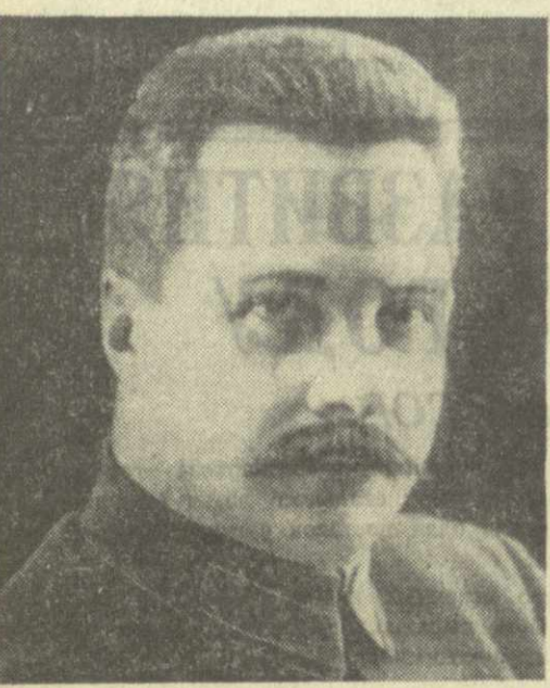
Михаил Васильевич Фрунзе.

Центральное статистическое управление при Совете Министров Грузинской ССР.