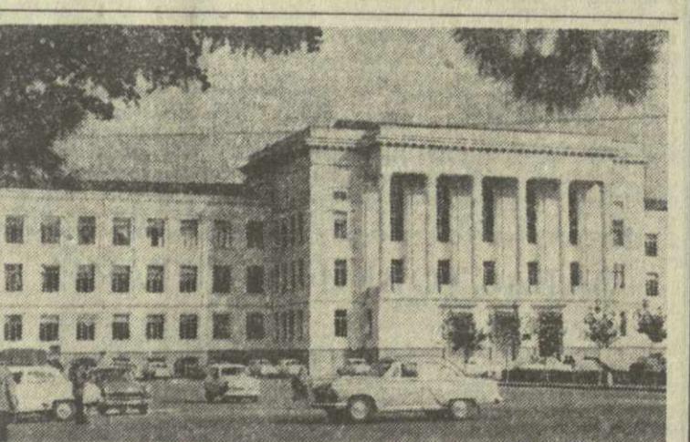
Тбилиси. Новый корпус Грузинского политехнического института имени Ленина.

Каждый день к автовокзалу беспеременно подходят экспрессы, следующие в Сочи, Адлер, Новый Афон, Сухуми и в другие города.