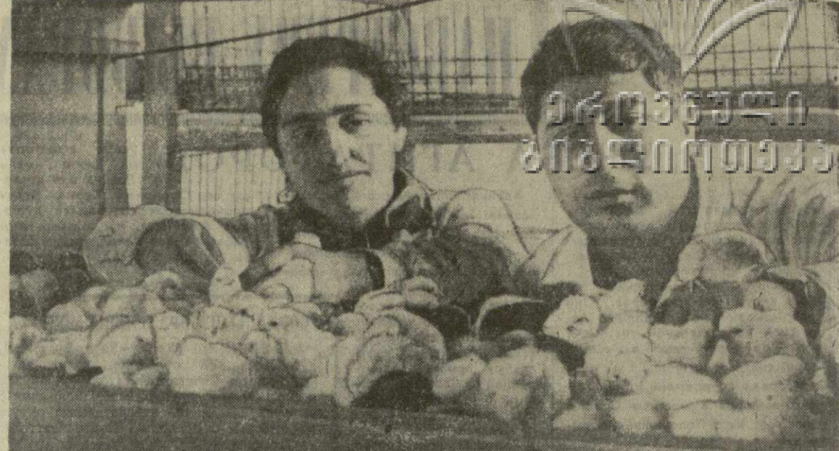
Хорошо начал последний год семилетки коллектив Тамариской птицефабрики Болнисского района. Переводные птицеводы выведут и вырастят свыше воумиллиона цыплят, сдадут государству 2.100 центнеров куринного мяса и 5.100 тысяч яиц.

Агитатор. В этом деле большая роль принадлежит нашим депутатам и вам, дорогие товарищи. Тысячи трудящихся Тбилиси являются активистами постоянно действующих комиссий городского и районных Советов депутатов трудящихся, членами групп и постов содействия партийно-государственному контролю. Чем активнее будут действовать наши Советы, тем лучше будет обслуживание трудящихся.