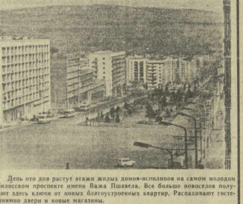
День ото дня растут этажи жилых домов-исполинов на самом молодом тбилисском проспекте имени Важа Пшавела. Все больше новоселов получают здесь ключи от новых благоустроенных квартир. Распахивают гостеприимно двери и новые магазины.

женную мембрану и встретится в потоке воды с отрицательным ионом хлора, который пройдет через положительно заряженную мембрану. Проще, натрий уйдет налево, а хлор — направо, посредние останется чистой водой. Коллективом института спонструировано несколько типов электроионитовых опреснительных установок. Стационарная электроопреснительная установка ЭОУ НИИПМ-12 предназначена для снабжения мелких населенных пунктов питьевой водой. Установка весторонне испытана в естественных условиях и успешно работает в Волгоградской области. Переносная электроионитовая опреснительная установка ЭОУ «Бархан» предназначена для снабжения Каракумов и геологических партий. Опытный образец уста-