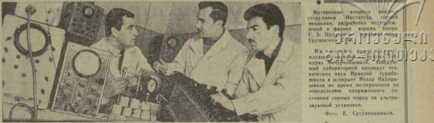
Интересные вопросы решают сотрудники Института горной механики, разработки месторождений и физики взрыва имени Г. А. Цулукидзе Академии наук Грузинской ССР.