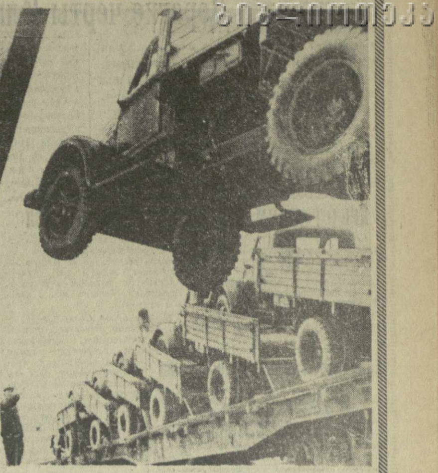
Центром автомобильной промышленности КНР является город Дакан. Здесь с помощью ЧССР был построен завод по производству запасных частей для автомобилей...