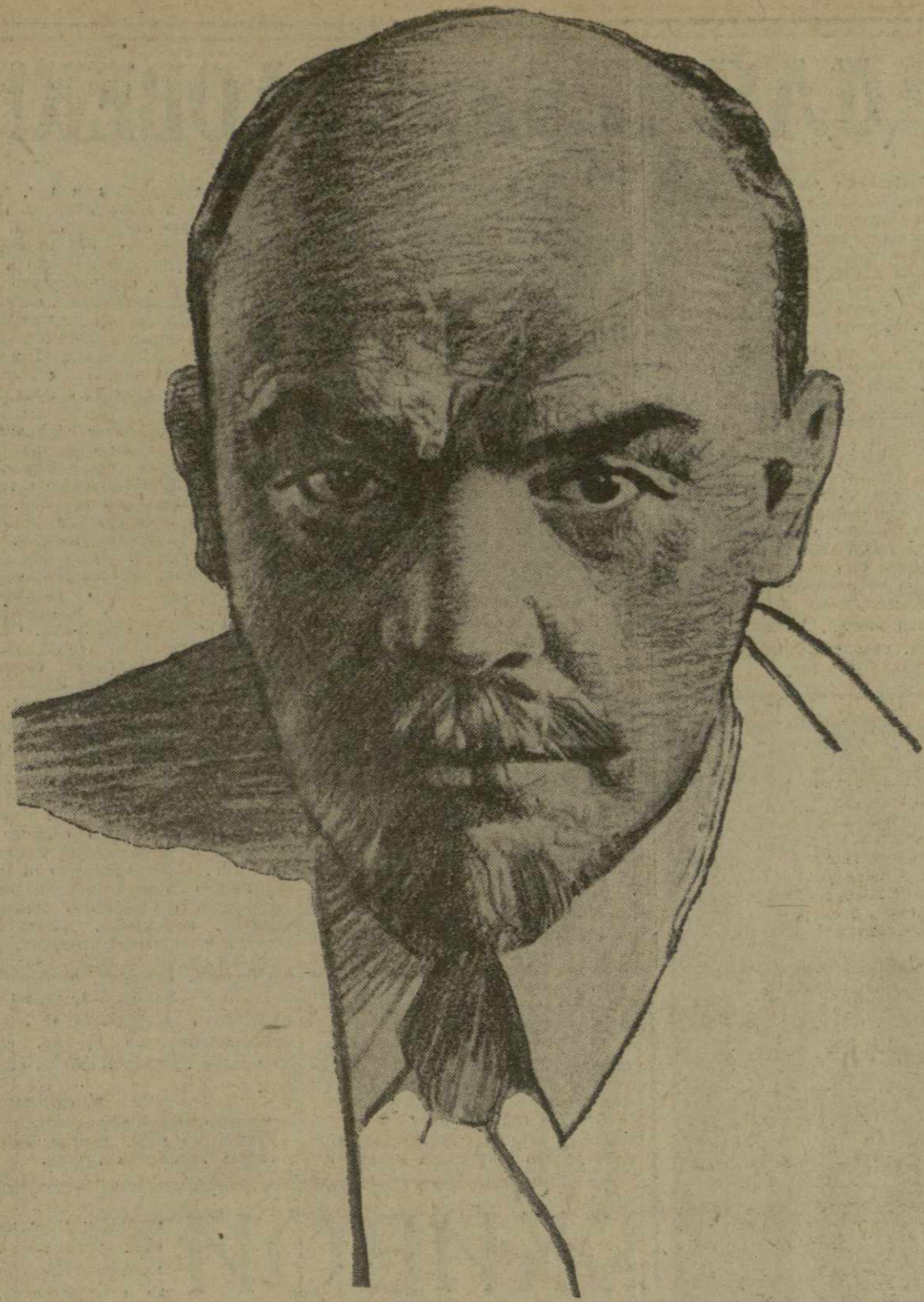
Портрет работы народного художника СССР У. Джaparидзе, делегата XXIII съезда Компартии Грузии.