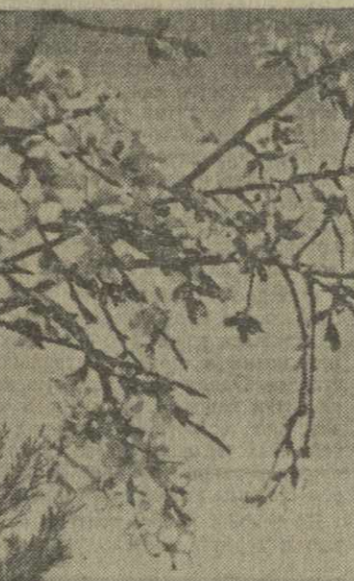
Душети сегодня.

заведующий фермой колхоза села Чолобарги Ланчхутского района, делегат XXIII съезда Компартии Грузии.