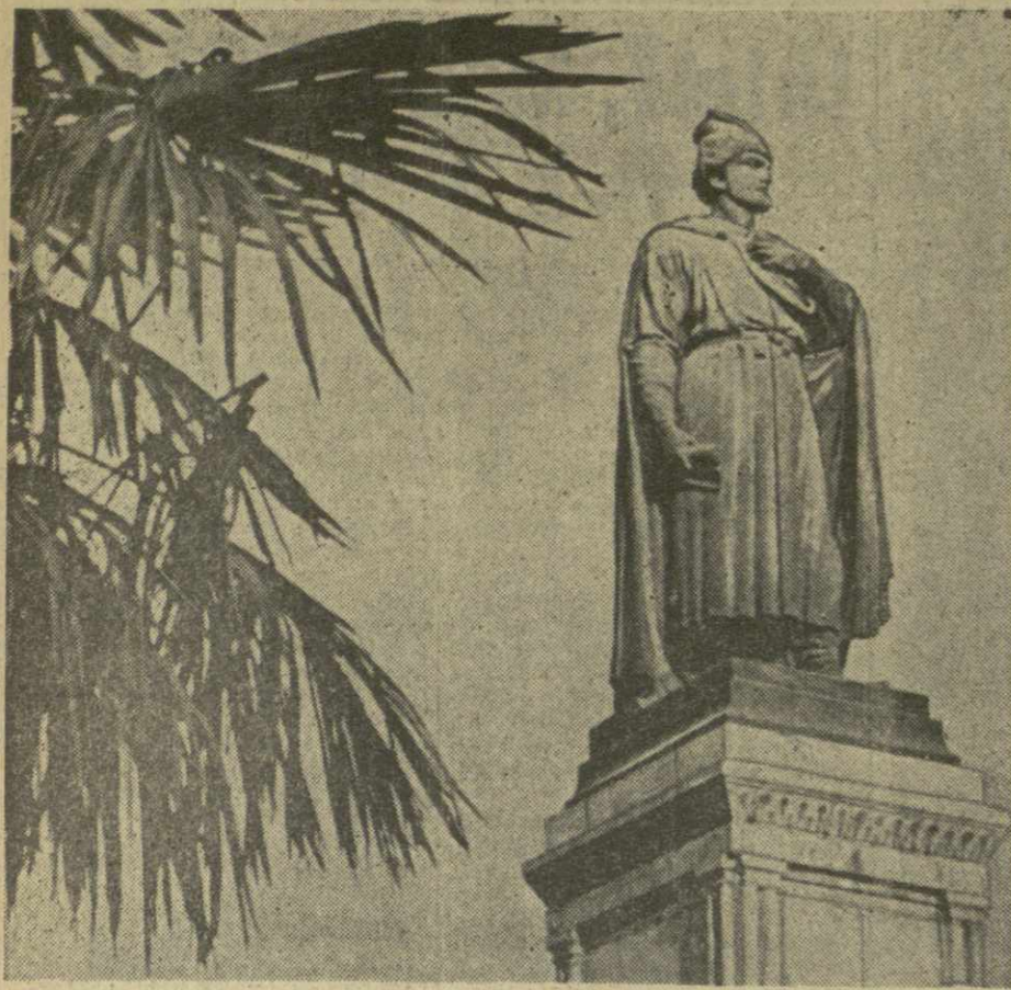
На снимке: памятник Шота Руставели в Тбилиси.