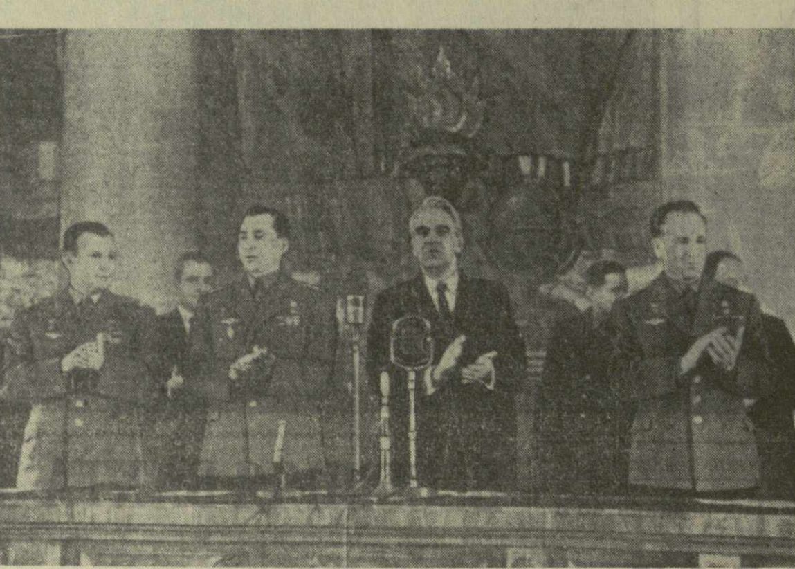
На снимке: президиум пресс-конференции.

И когда в процессе подготовки к посадке по автоматическому циклу спуска мы заметили некоторые ненормальности в работе солнечной системы ориентации, нас это даже обрадовало. Ведь теперь у нас появилась возможность совершить посадку вручную и тем самым раскрыть еще одну замечательную способность советских пилотируемых, теперь уже в полном смысле этого слова, космических кораблей. Откровенно говоря, мы боялись только одного, что нам не